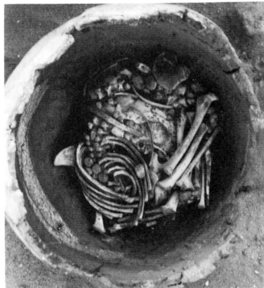
Fig. 1. La Nécropole du Bas : sépulture d'enfant dans une jarre.

Située près du camp de base, elle a été découverte accidentellement cette année, et, pour l'instant, elle n'a été reconnue que sur un sondage de 9 m 2 qui a déjà livré les sépultures intactes de deux jeunes enfants — dont l'un en pot [fig. 1] — et d'un adulte. Celles-ci, situées à environ 20 cm sous le sol, sont creusées dans du limon. Elles sont tout à fait semblables à celles fouillées par F. Debono en 1973, à moins de 200 m de là, dans une zone à présent cultivée. Pour l'instant, à l'exception de leur datation prédynastique, rien ne nous permet d'en savoir plus sur leurs liens avec l'autre partie de la nécropole. La campagne 1993 s'intéressera plus spécifiquement à cette zone qui semble susceptible de livrer dans les années à venir (si les cultures sont stoppées) au moins 300 tombes intactes selon une approximation grossière.