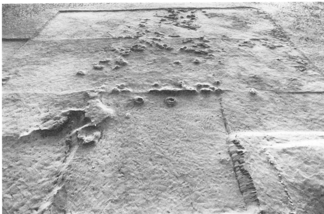
Fig. 6. Ensemble 1001 : vestiges de sol d'habitat (trous de poteaux possibles repérables dans les blocs de sable indurés).