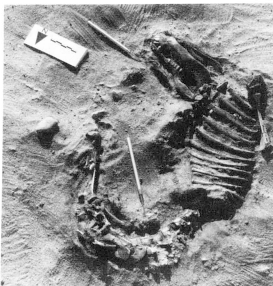
Fig. 7. Ensemble 1001 : sépulture de jeune cochon en sac de cuir.

D'un point de vue paléoéconomique, le tableau 1 démontre clairement que les habitants du site pratiquaient surtout l'élevage et la pêche. La chasse aux oiseaux, à l'hippopotame, au lièvre, à la gazelle et au mouflon à manchettes, n'était pratiquée que très occasionnellement. Apparemment, les animaux domestiques (bœufs, chèvres, moutons, porcs) étaient les principaux fournisseurs de protéines animales. Malgré le nombre limité de restes permettant de préciser l'âge des animaux abattus, il apparaît que les bœufs étaient en grande partie tués à partir de deux ou trois ans. Le mouton était abattu plus tôt que la chèvre, un phénomène assez classique lié au fait que la chèvre est aussi fournisseur de produits laitiers. À part quelques individus gardés pour la reproduction, les porcs étaient consommés dans leur deuxième année au plus tard. À cet âge, le porc a quasiment terminé sa croissance. Excepté les animaux élevés pour la consommation,