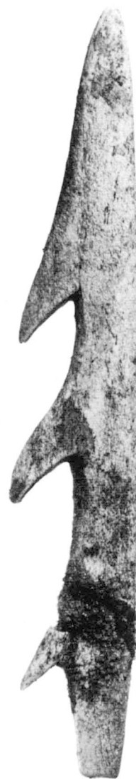
Fig. 3. Le harpon de la tombe n° 100. hauteur = 18 cm

Qu'il nous soit permis d'avancer ici une hypothèse que la poursuite des fouilles pourra confirmer ou infirmer : cette association particulière entre données biologiques et culturelles pourrait évoquer, pour cette époque (Nagada II C-D) l'existence d'une caste de guerriers très puissants qui devaient accéder par leur force physique à un rang social élevé.