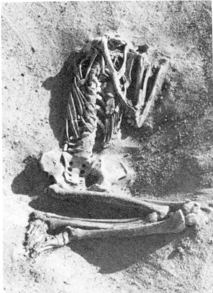
Fig. 2. La nécropole du Haut : tombe en sac de cuir sous natte; la partie céphalique du squelette a disparu.

Dans ce domaine, l'élément le plus pertinent de l'année a été la mise au jour d'une tombe en sac de cuir sous natte dont la partie céphalique avait disparu [fig. 2]. Cette tombe