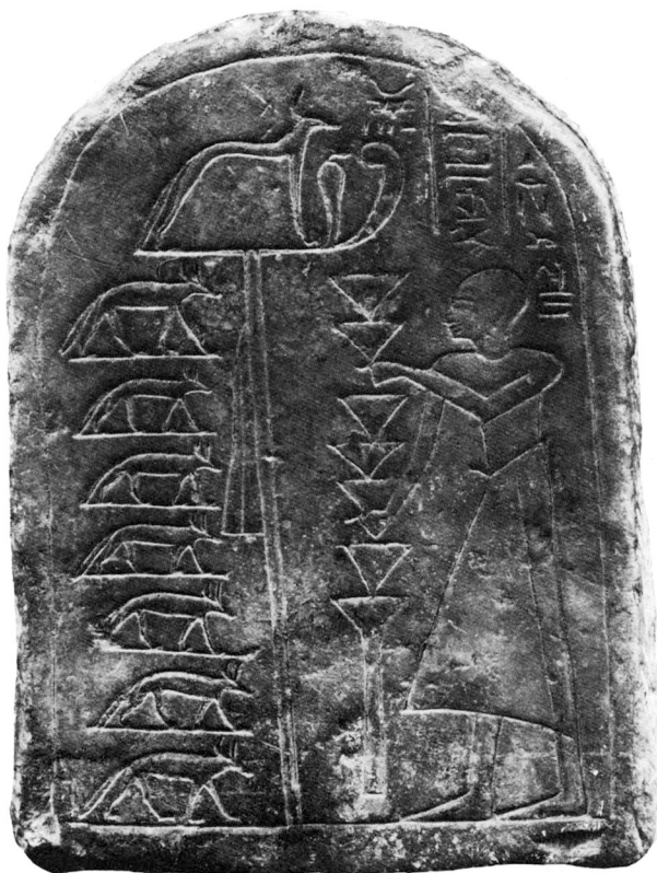
Fig. 2 Stèle 19594 de Berlin