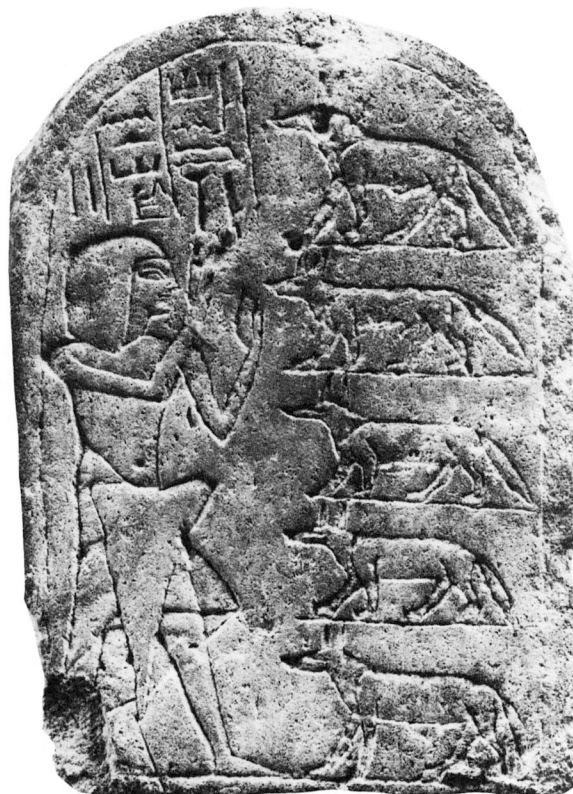
Fig. 3 Stèle 20756 de Berlin

de cœur 18 . Deux des canidés représentés pourraient être des femelles 19 . Contrairement aux deux autres stèles, le dieu est absent.