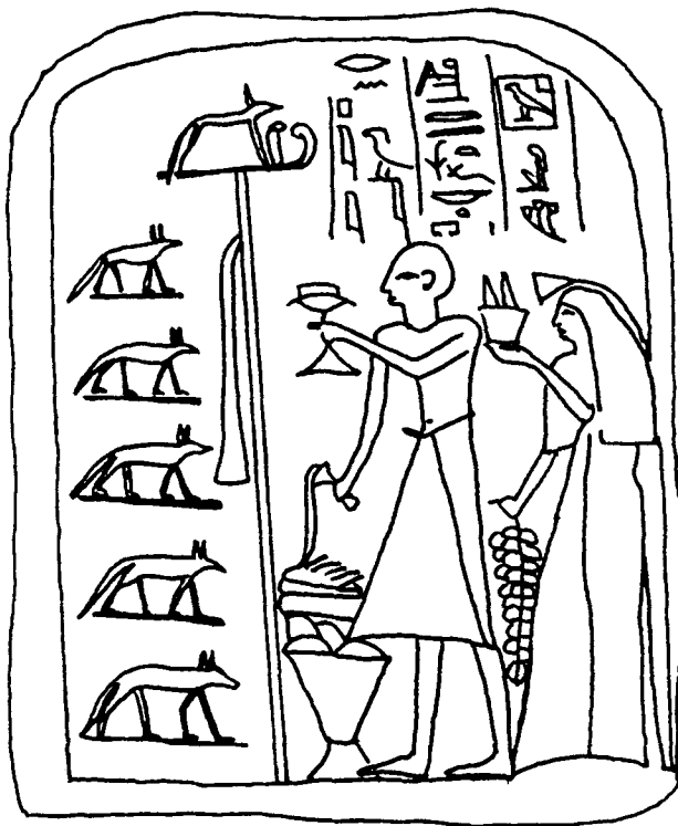
Fig. 7 Stèle BM 1725