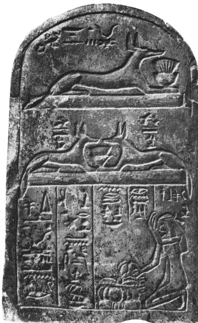
Fig. 1 Stèle du Louvre AF 6949

Les seuls exemples où le dieu est montré couché nous viennent d'Abydos où l'usage veut que l'on représente les dieux canidés dans la partie supérieure des stèles, juste au-dessous du cintre. On pourrait, comme J. Spiegel, invoquer des critères esthétiques pour expliquer cette « anomalie » 11 . Un canidé juché sur un pavois dans le cintre d'une stèle risque en effet de compromettre l'équilibre général du monument. Mais peut-être est-ce aussi en raison de son rôle de « gardien de la nécropole » qu'Oupouaout était représenté couché en train de veiller sur les morts, fonction qu'il avait précisément héritée d'Anubis à Abydos 12 .