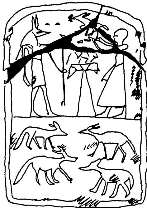
Fig. 4 Stèle 185 du musée du Caire