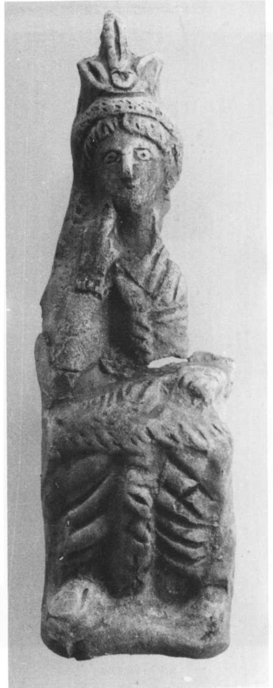
Doc. I-6, a. Isis assise de Pétra.