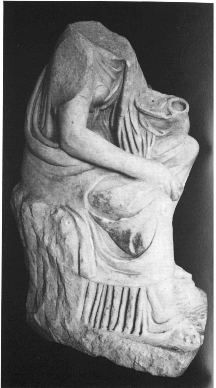
a. Vue de gauche.