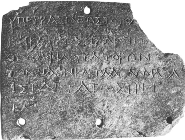
Doc. E-1. Dédicace à Isis de Taposiris (Luxor ?) © Ägyptisches Museum, Berlin.