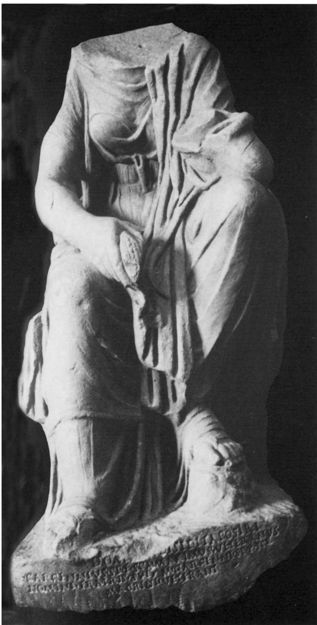
b. Vue de face.