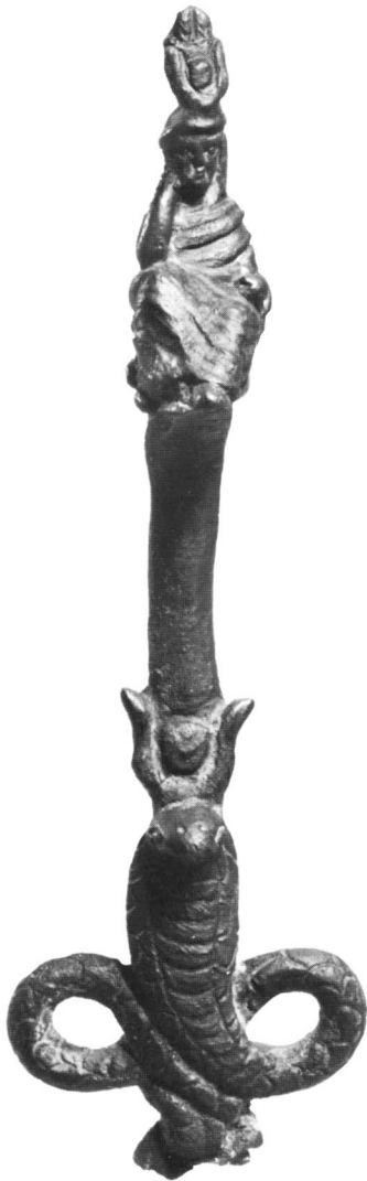
Doc. I-3. Isis assise sur un pilastre, Égypte.[Éch.1/1]