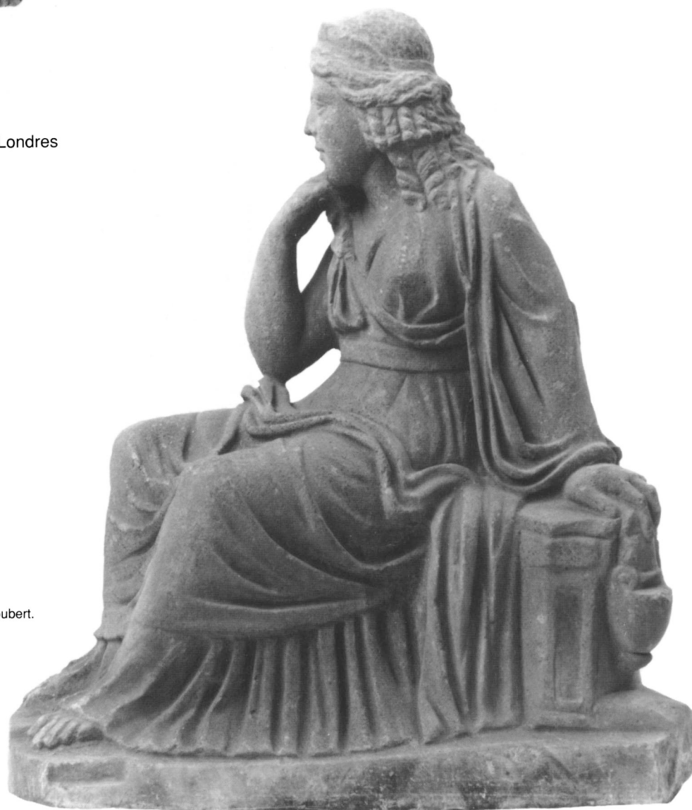
Doc. I-1. Isis assise.