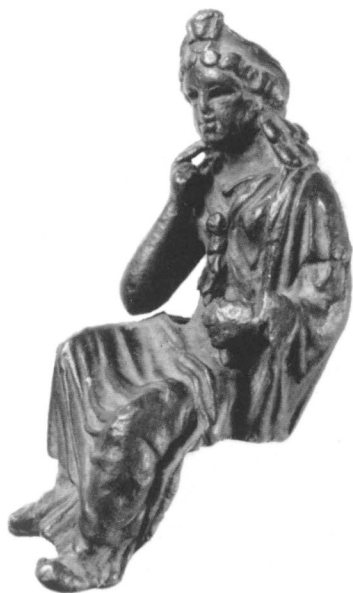
Doc. I-2. Isis assise de Londres © Museum of London.