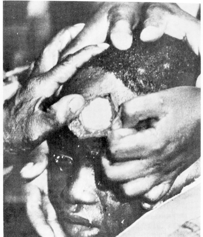
A. — L'opération de trépanation faite à un garçon de 9 ans dans la région de Kisii (Kenia) (d'après R. Meschig et H. Schadewaldt — 1982).