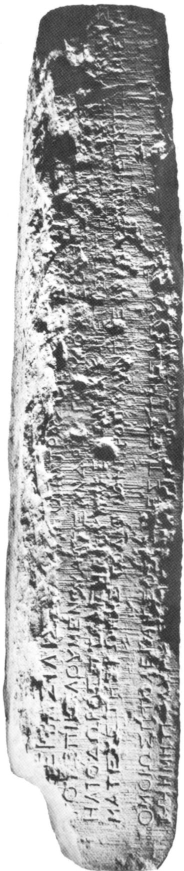
La dédicace du linteau.