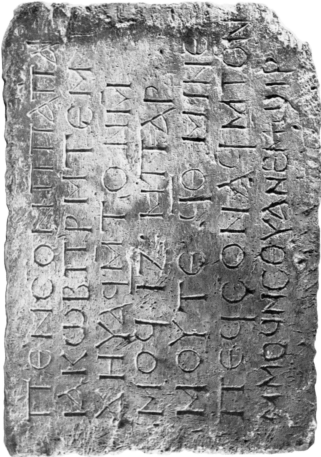
Stèle A (Louvre E. 27.221).