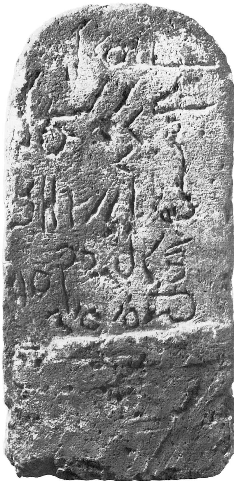
B. — Stèle dém. IFAO n° 2 (éch. 1 : 2).