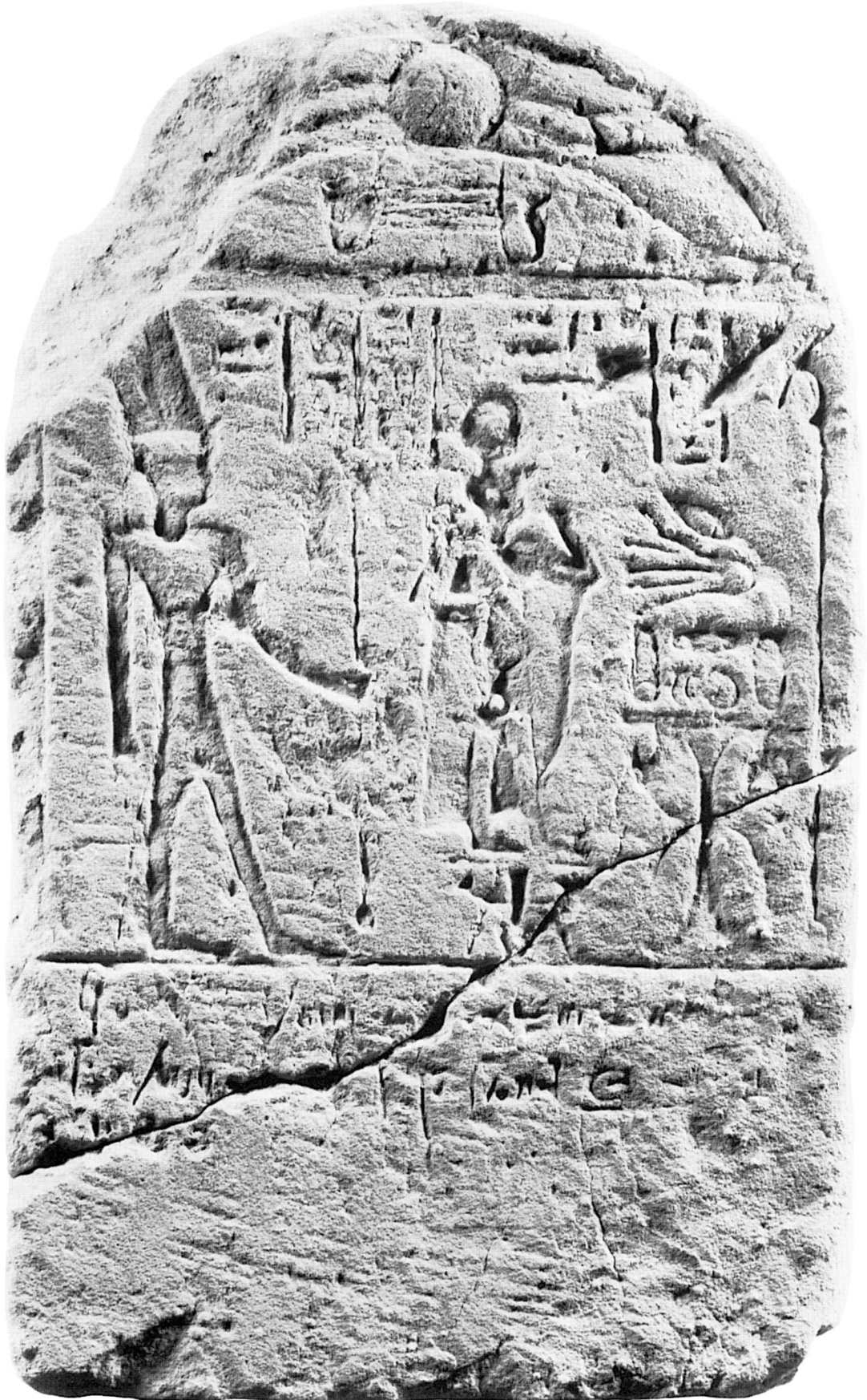
Stèle dém. IFAO n° 3 (éch. 1 : 1).