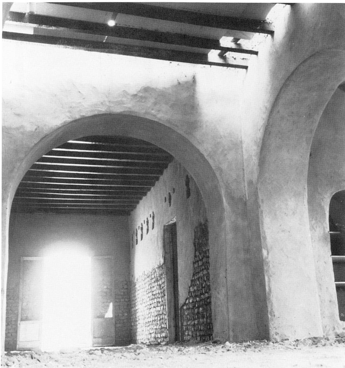
Construction d'un magasin sur le site de Douch.