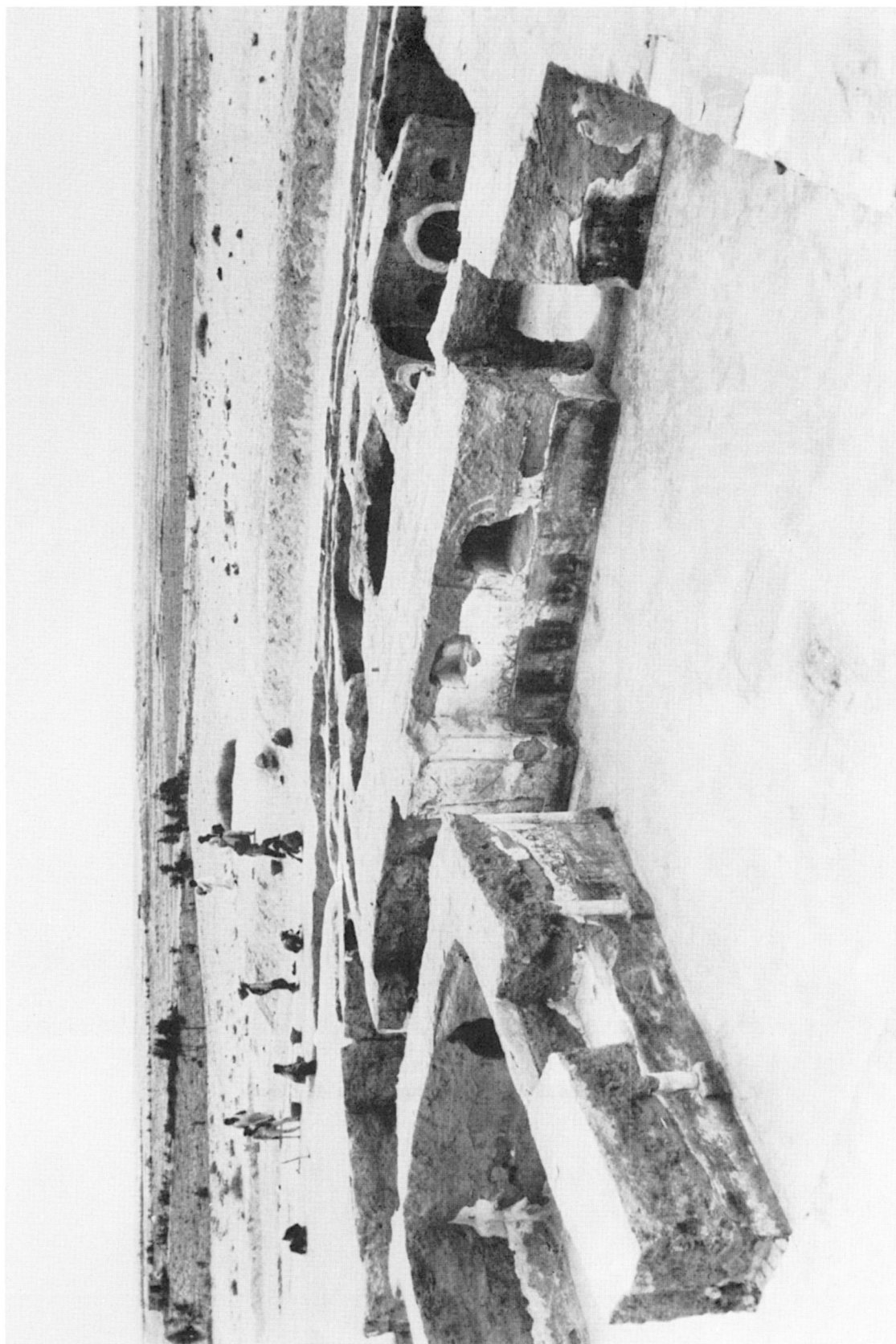
Kellia — L'ermitage du kôm n° 167.