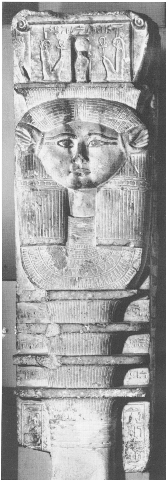
Pilier de Neferhotep, Caire JdE 18928.