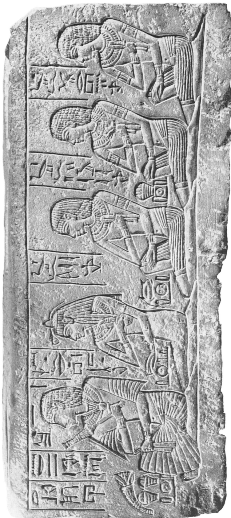
Côté gauche du socle.