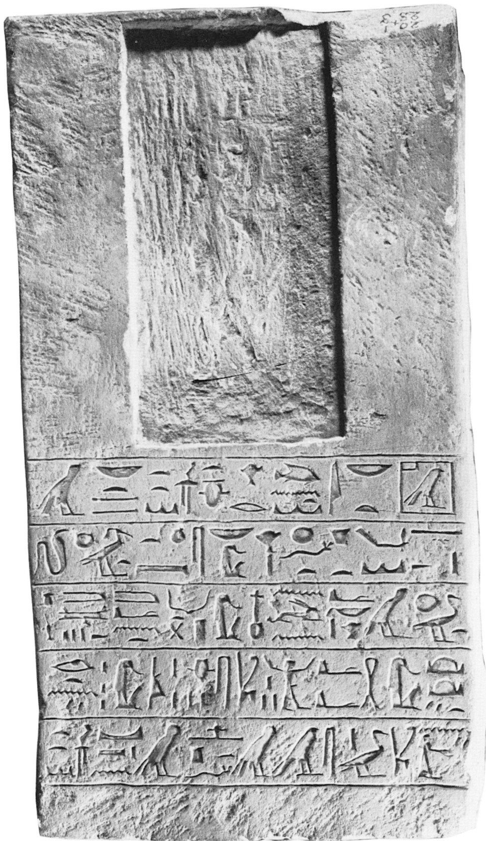
Mon. d'Imeneminet/Iny. Caire JdE 14126. Dessus du socle.