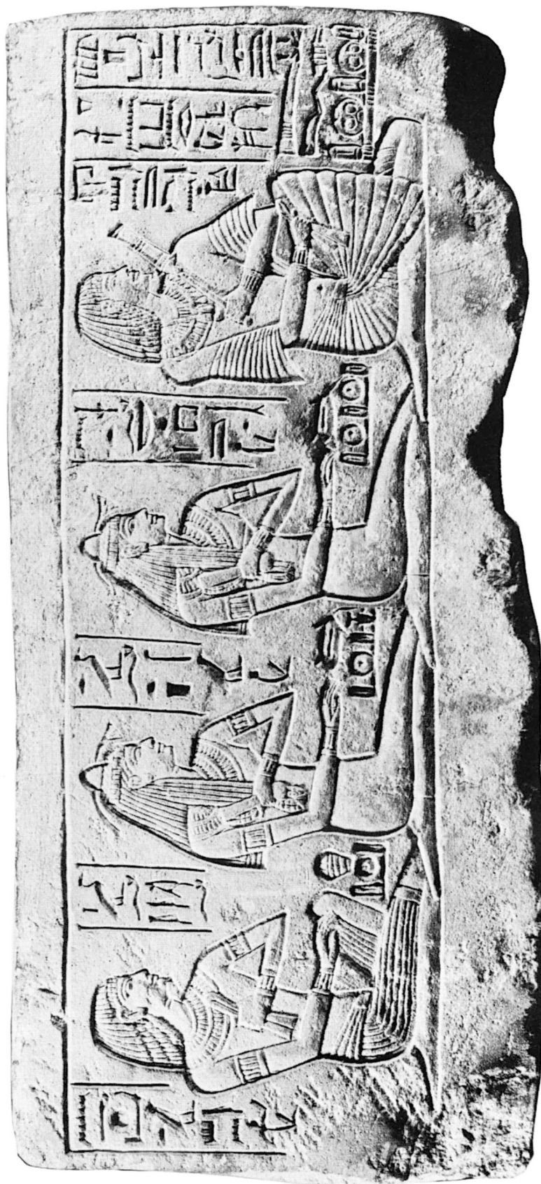
Côté droit du socle.