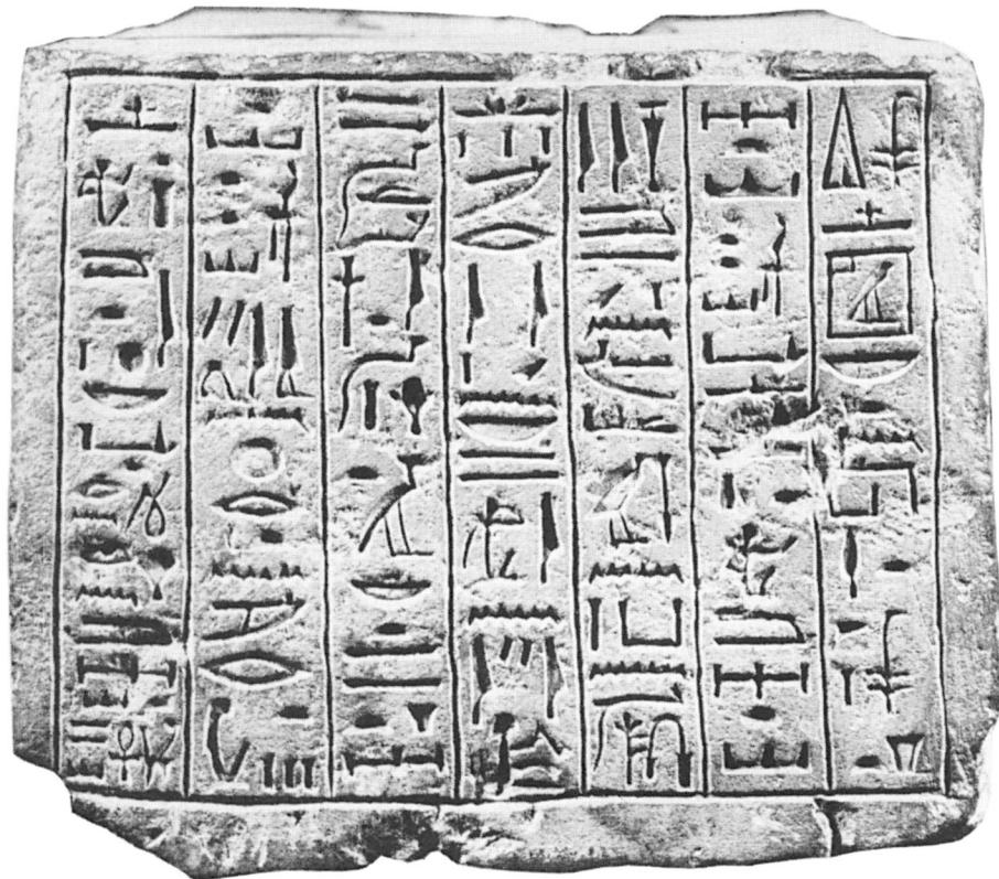
Avant du socle.