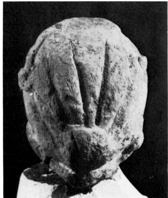
Tête féminine découverte à Douch.