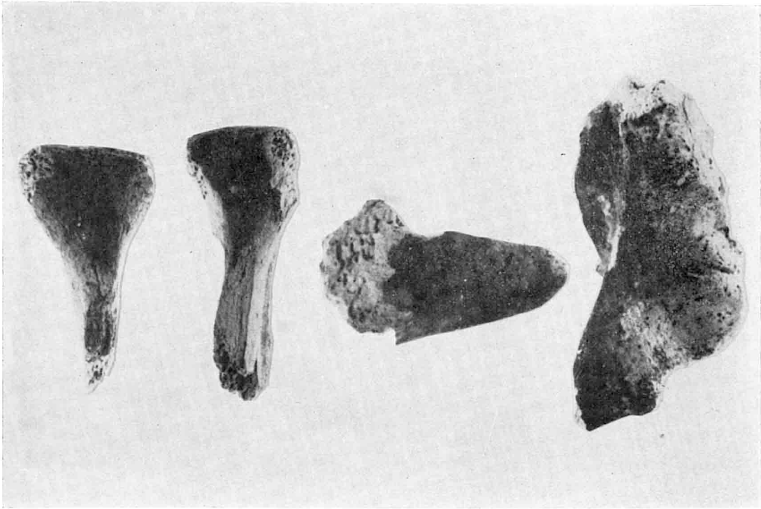
A. — Os de crâne du Gouverneur.