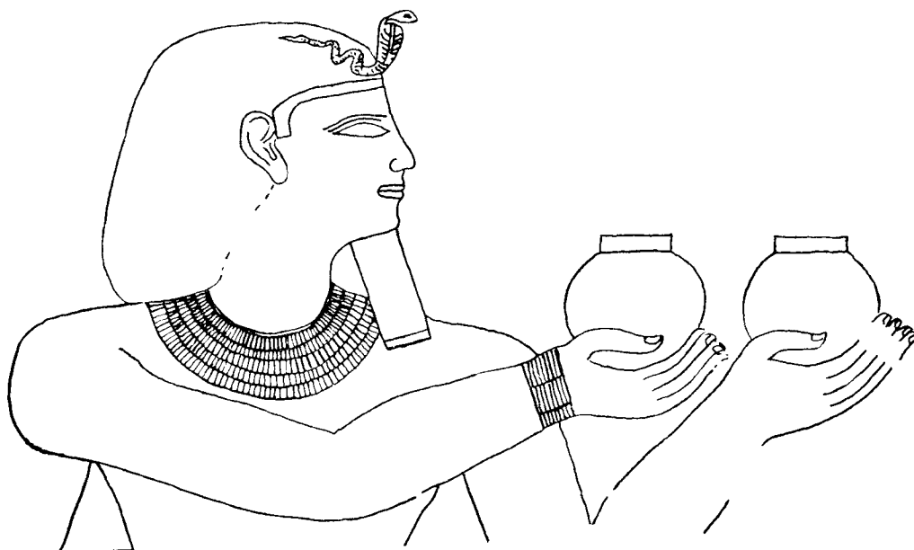
Fig. 1. — Sebekemsaf I, porche de Sésostri III trouvé à Médamoud ( FIFAO , VII, pl. VII).

Moyen Empire qui représentent un roi coiffé du serre-tête « h 3 ·t » (fig. 2) (1) . Bien que la « h 3 ·t » soit constamment accompagnée d'une barbe postiche, à la 18 e dynastie (2) , ce cas n'est qu'une exception parmi les reliefs précédant le Nouvel Empire. Cette exception se manifeste dans la région thébaine, et elle n'est pas attestée par notre relief.