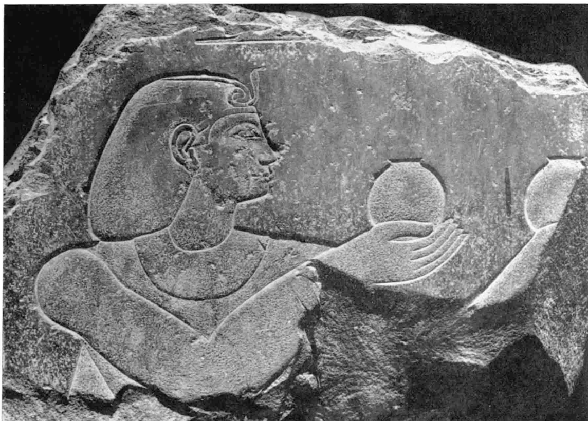
A. — Amenemhet III (?), relief au Musée du Caire, 18/11/14/22.