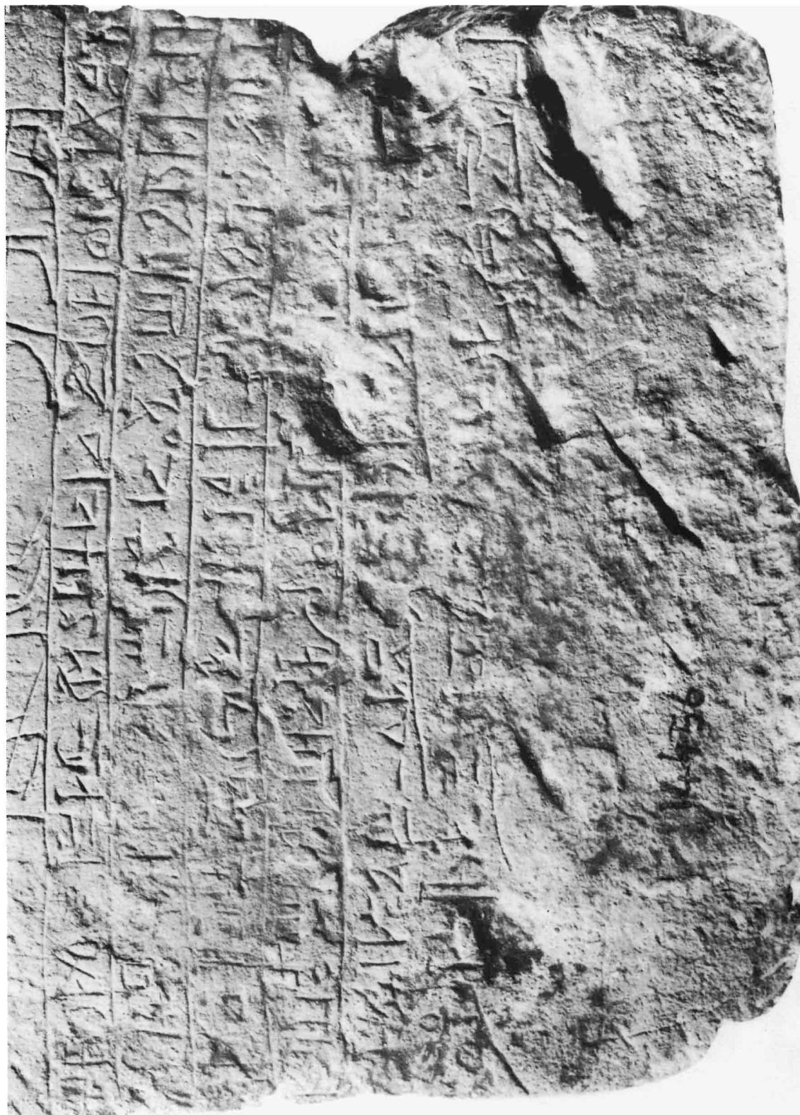
Détail du texte de donation.