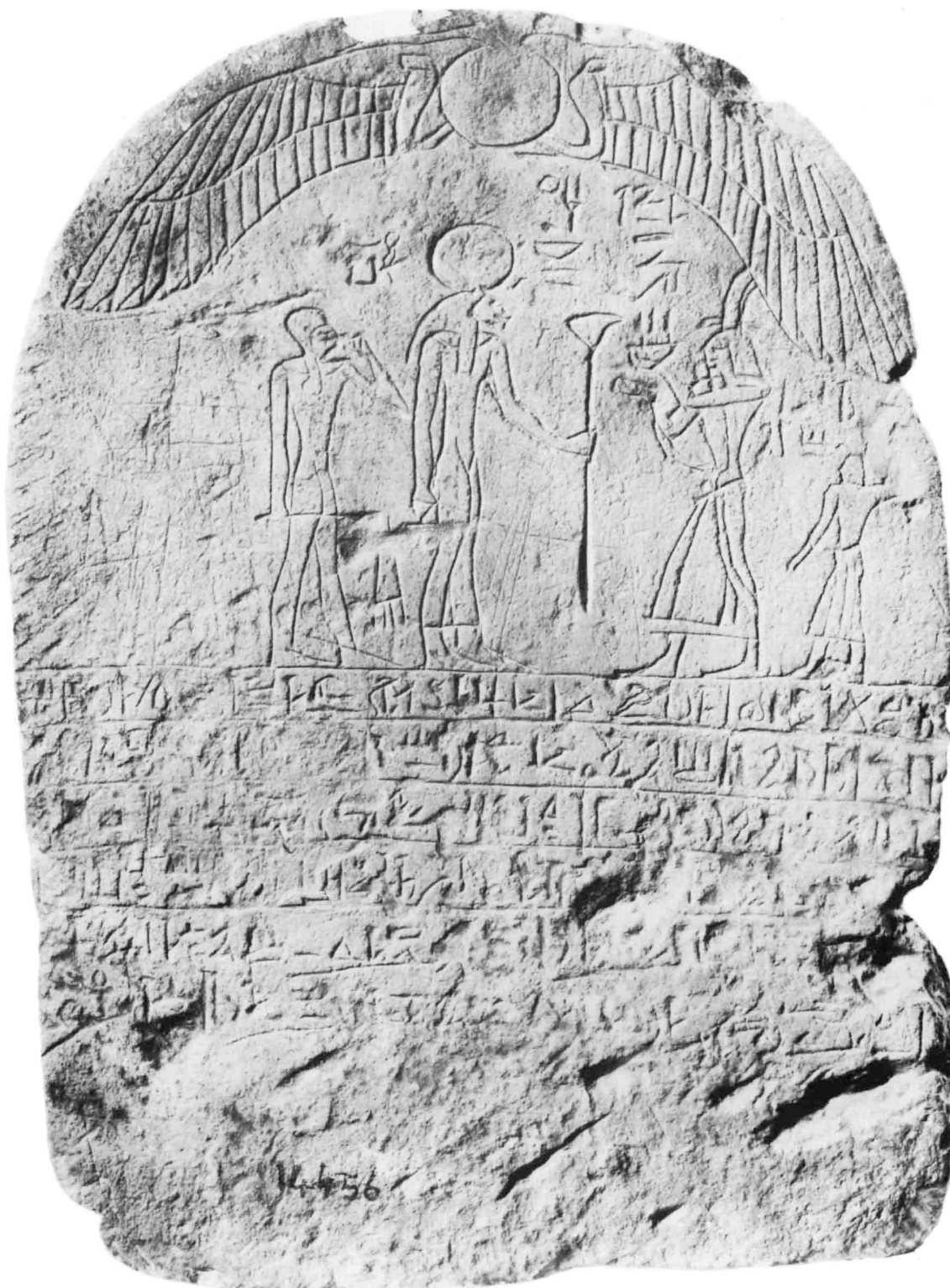
Stèle de donation de Roudamon.