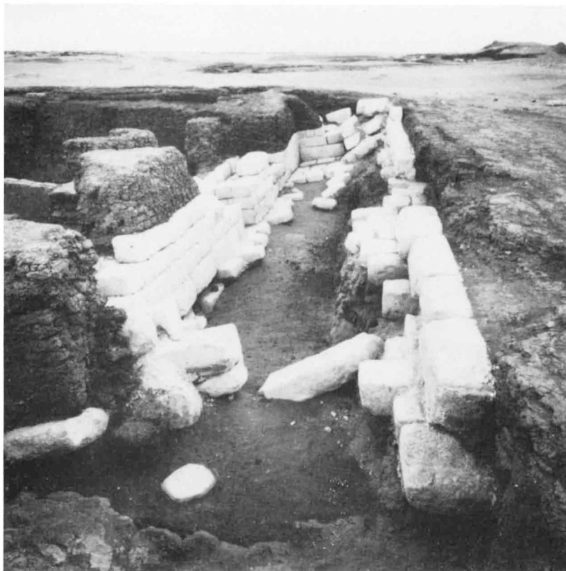
B. — Mastaba n° 3, salle 3 vue du Nord.