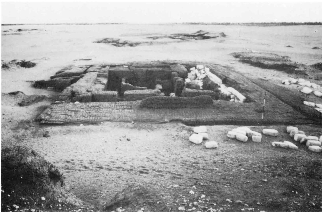
A. — Mastaba n° 3, vue générale.