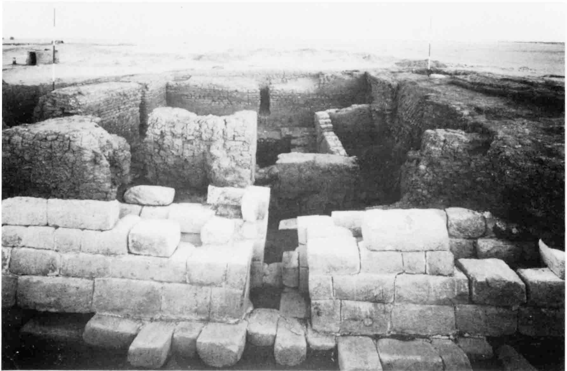
A. — Mastaba n° 3, vue de l'Ouest.