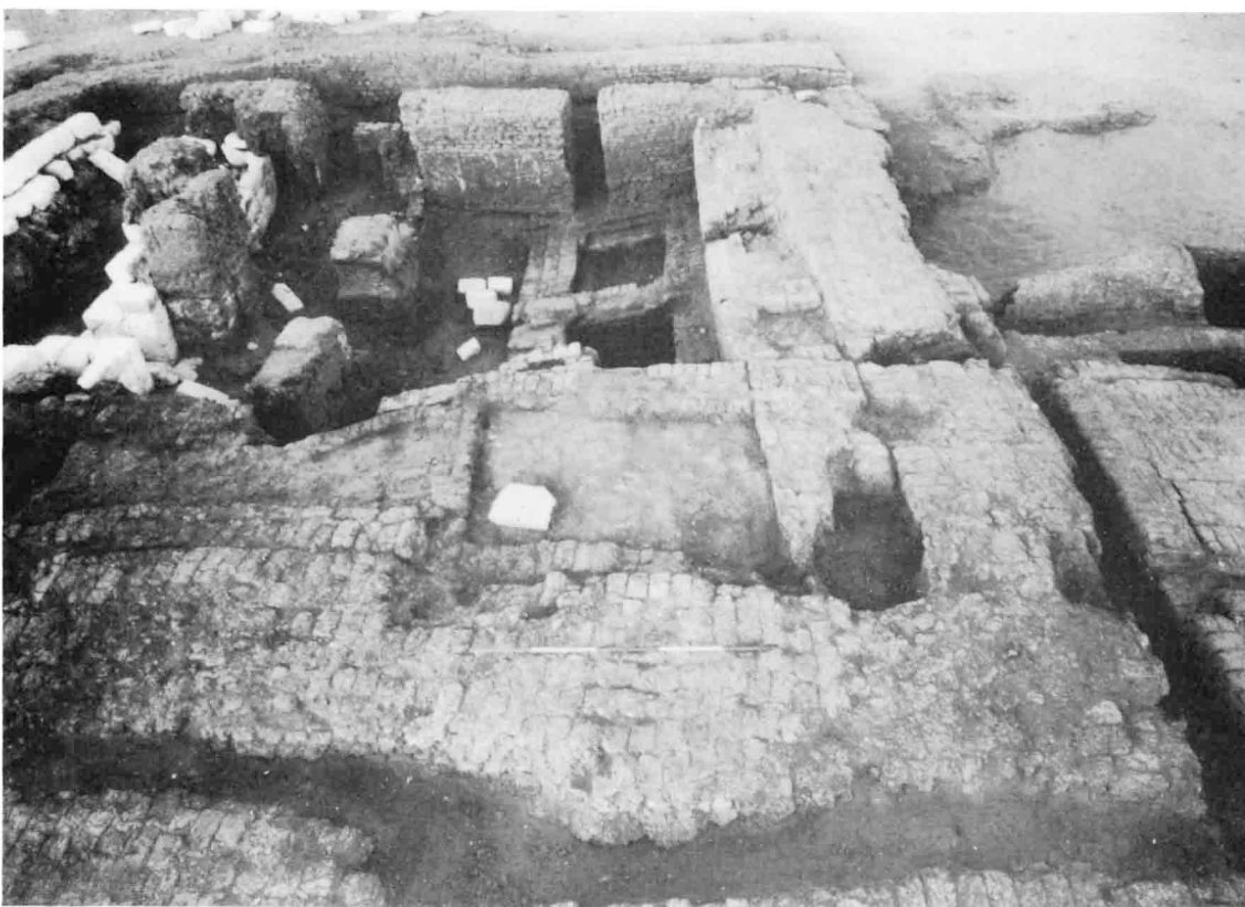
B. — Mastaba n° 3, partie Est.