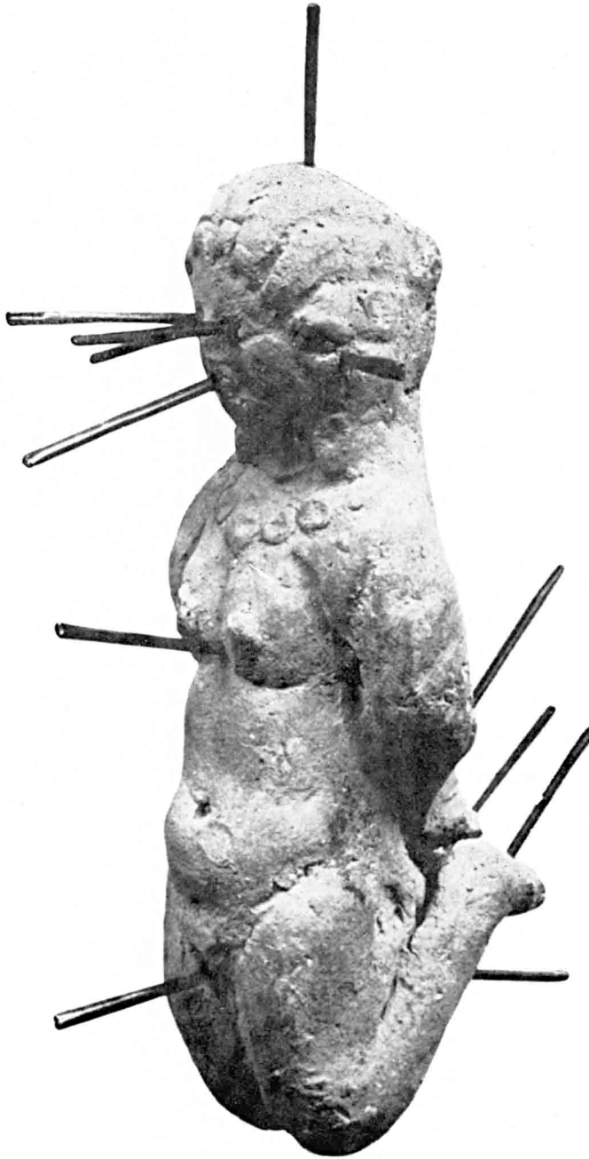
Statuette de femme en argile percée d'aiguilles (Musée du Louvre, inv. E 27145 — III e /IV e siècle).