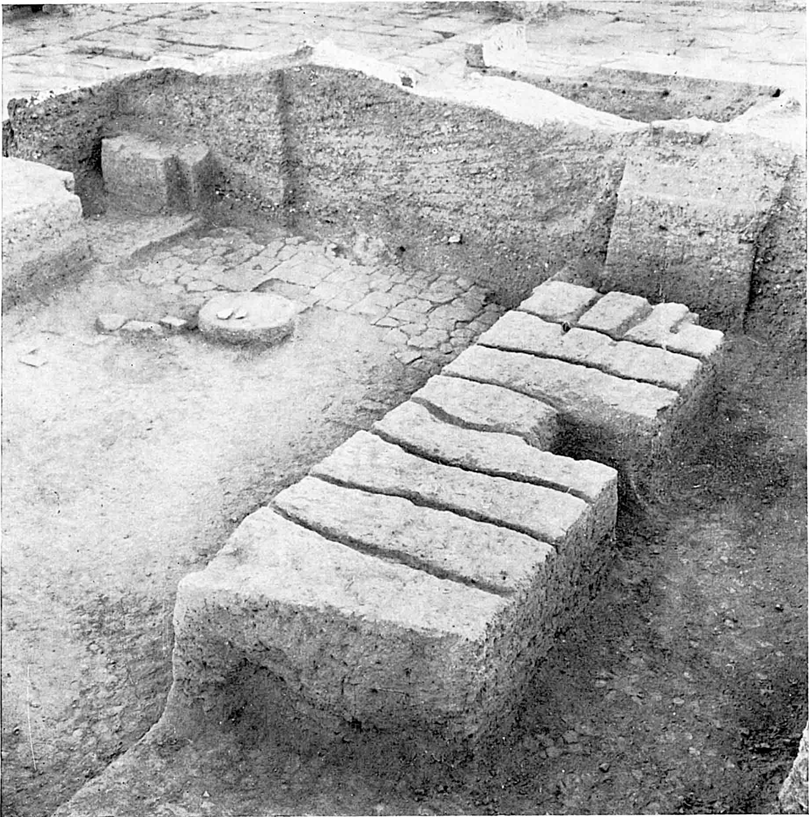
Un mur du bâtiment de la XXI e dynastie avec ses chaînages de renforcement en bois.