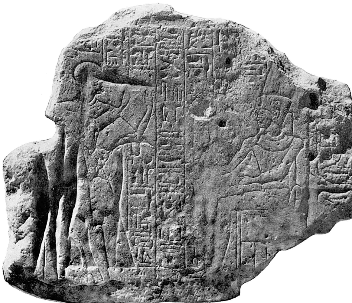
Linteau fragmentaire en grès : Le Premier Prophète d'Amon Amenhotep fils de Ramsès-Nakht adorant Amon-Ré'. Haut. 0,70 m. (inv. A.B. 170).