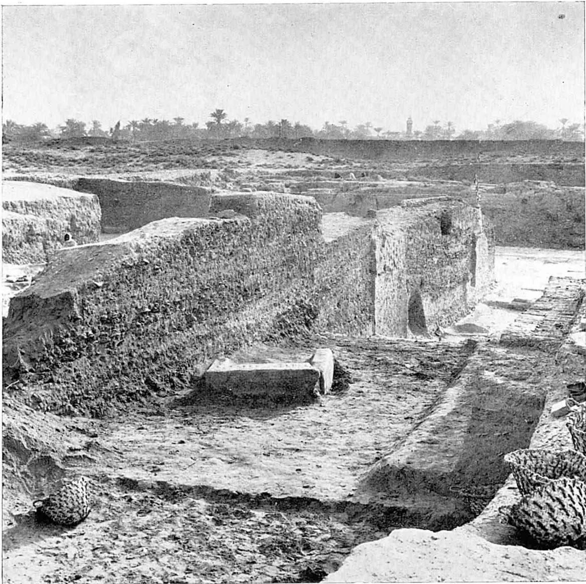
Coupe stratigraphique pour l'étude de la céramique.