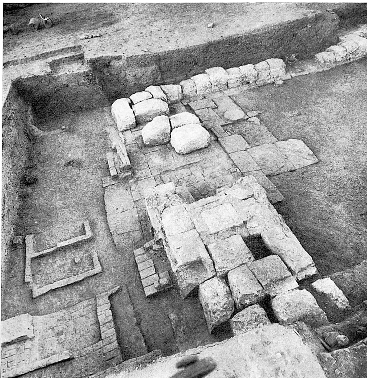
Les restes du pylône en calcaire et sa porte. Vue prise du Sud-Ouest.