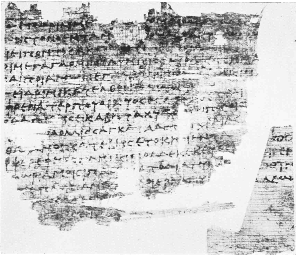
A. — Iliade Z 280-292.