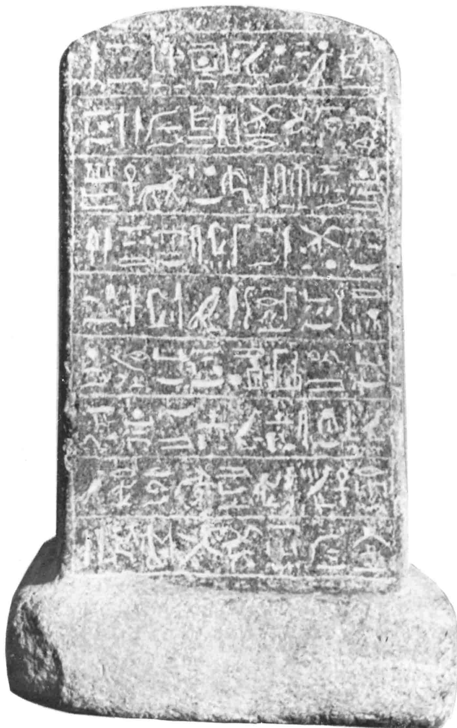
Statue du vizir Pasar, stèle.