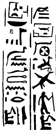
Fig. 1 (Echelle \frac{1}{5} )

C'est un très beau bloc de granit grisâtre, aux grains de taille moyenne,