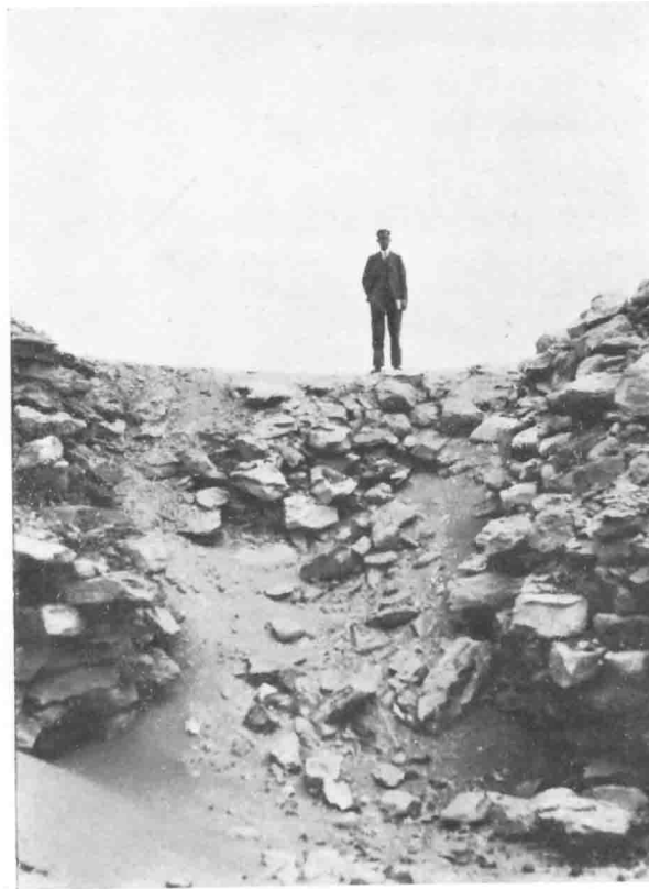
Éventrée, la pyramide laisse voir une structure interne peu soignée.

A. Pochan, Pyramide de Seila (au Fayoum) .