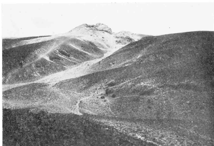
La pyramide vue du Nord.