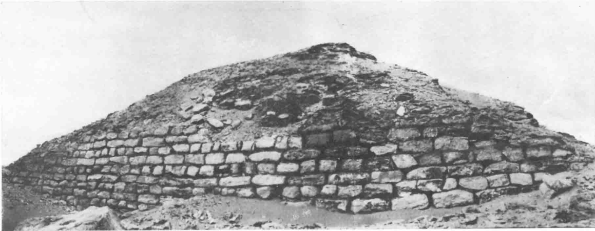
Face W. de la Pyramide de Seila.