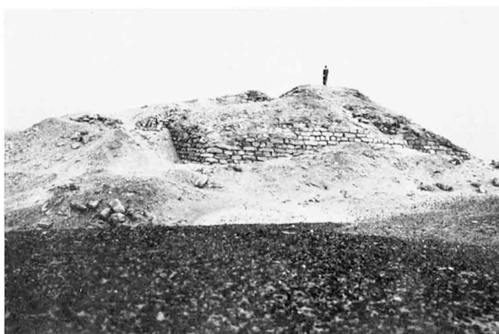
La pyramide vue du W.-N.W.

A. POCHAN, Pyramide de Seila (au Fayoum) .