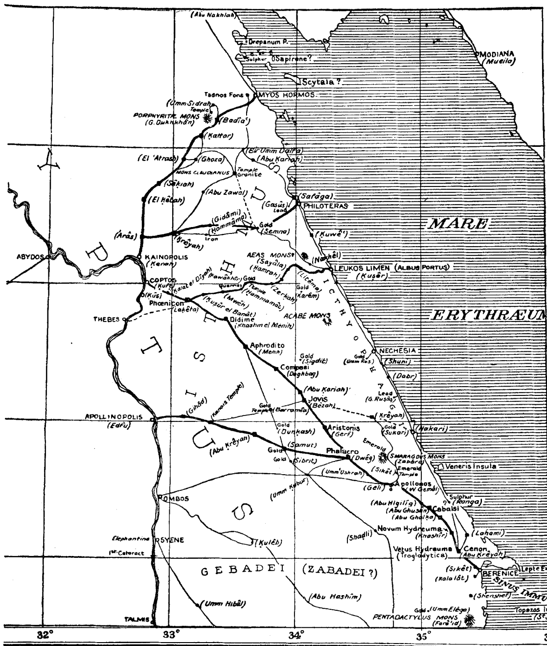
Les routes romaines du Désert arabe (d'après G. W. MURRAY, The Journal of Egyptian Archaeology , vol. XI, pl. XI, p. 139).