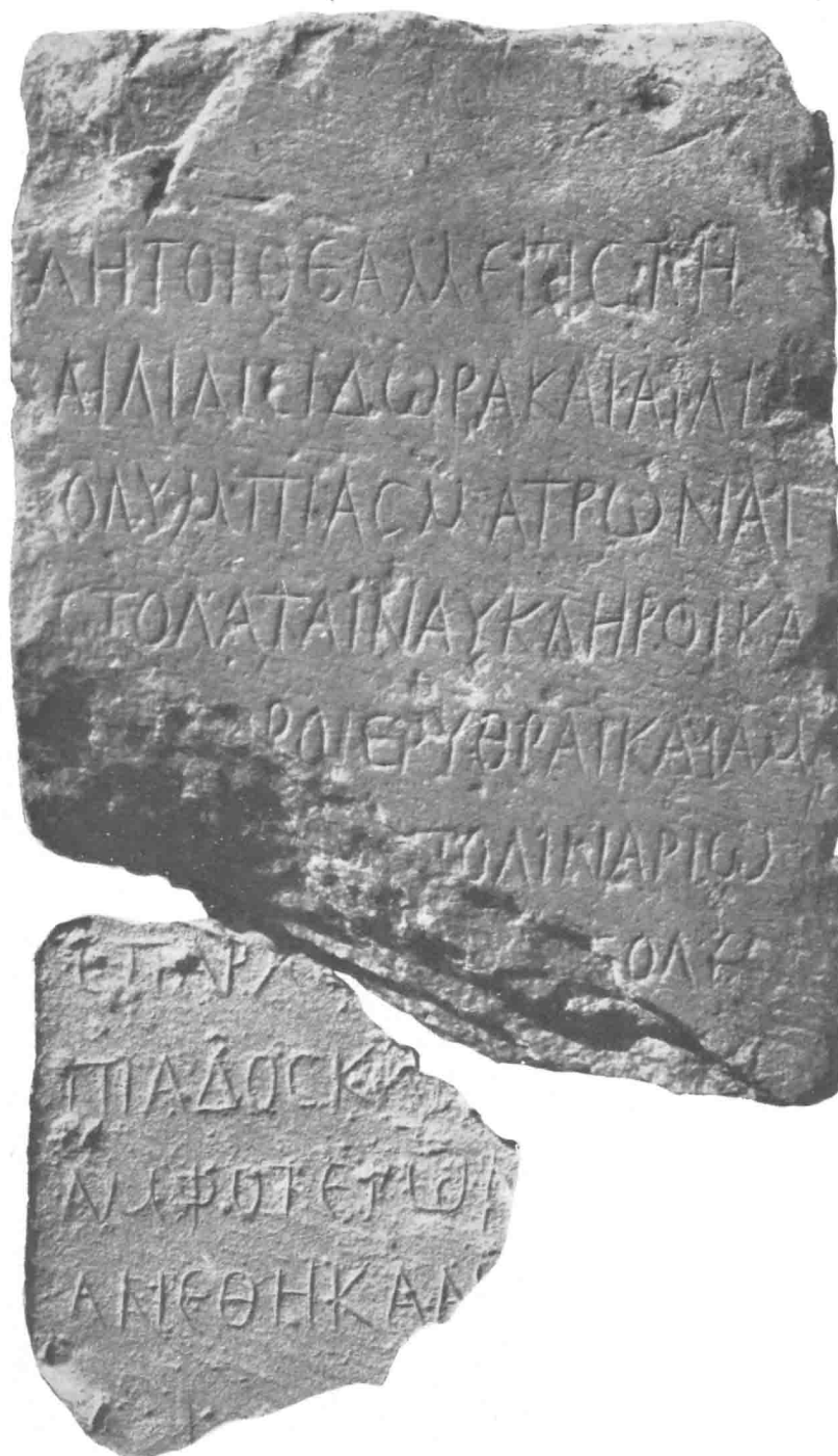
Dédicace grecque de Médamoud.