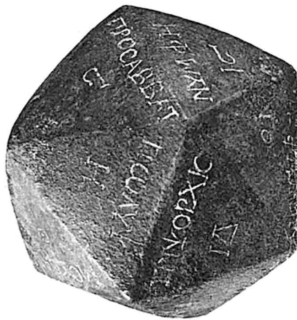
Icosaèdre inscrit, en bronze. (Collection de S. M. le roi Fouad I er ).