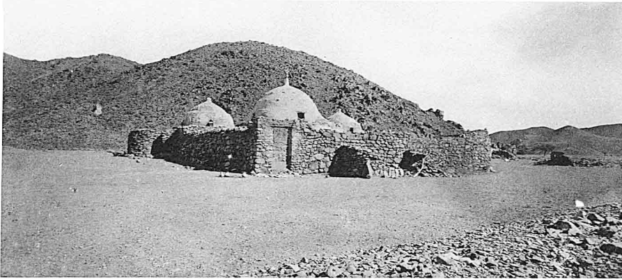
1. — Tombeau du cheikh Echchadily.