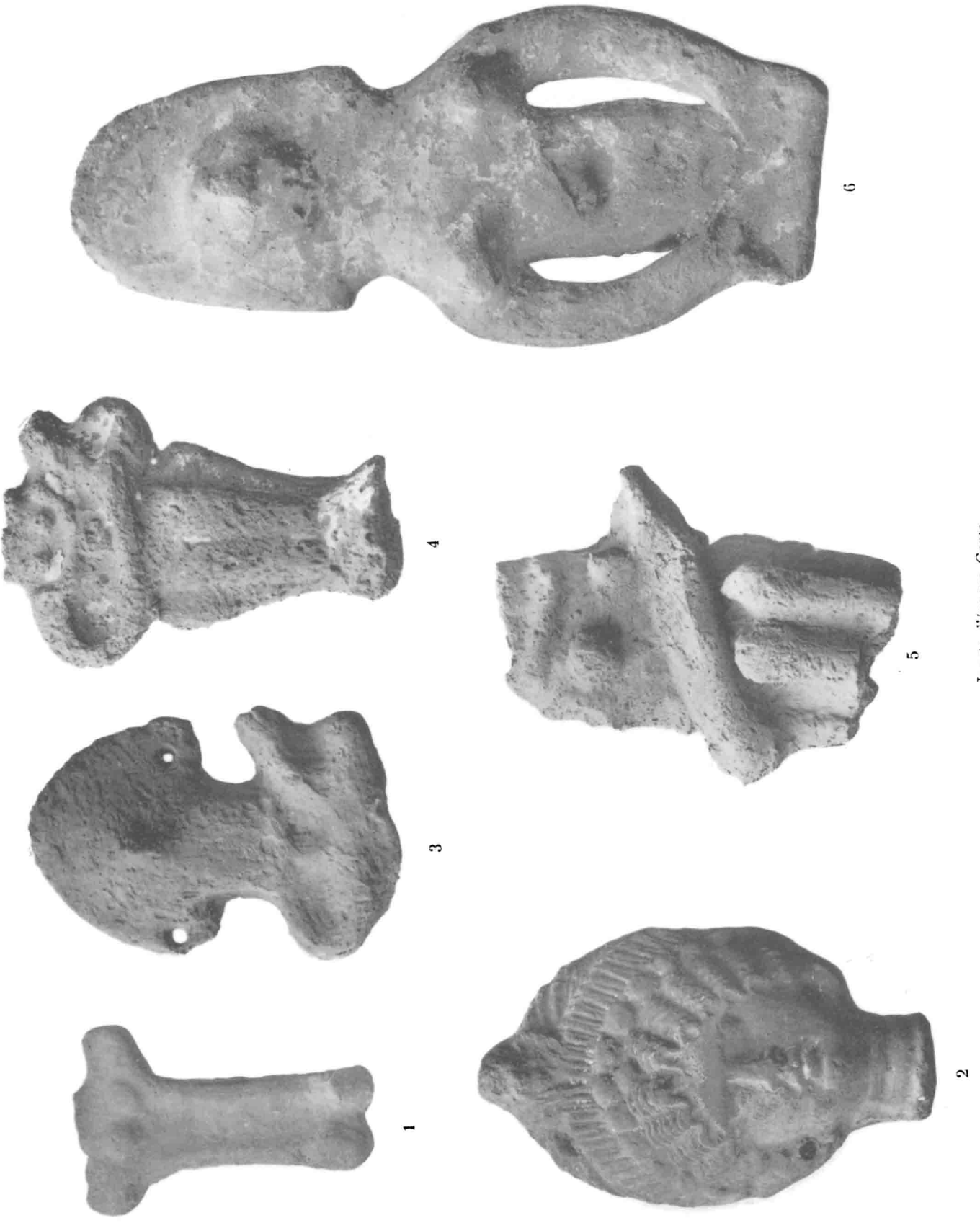
Jouets d'époque Copte.