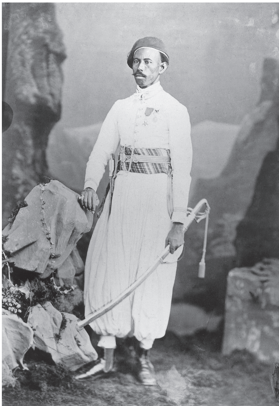
Capitaine au bataillon égyptien du corps expéditionnaire du Mexique, 1867, photographie (musée de l'Armée – Paris).