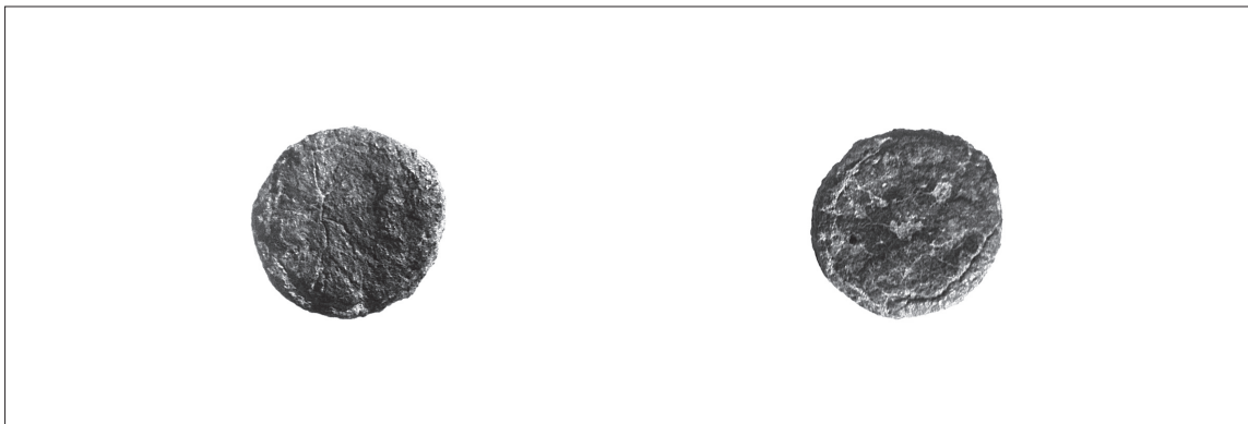
7. N° 89007 (SA n° 8906).