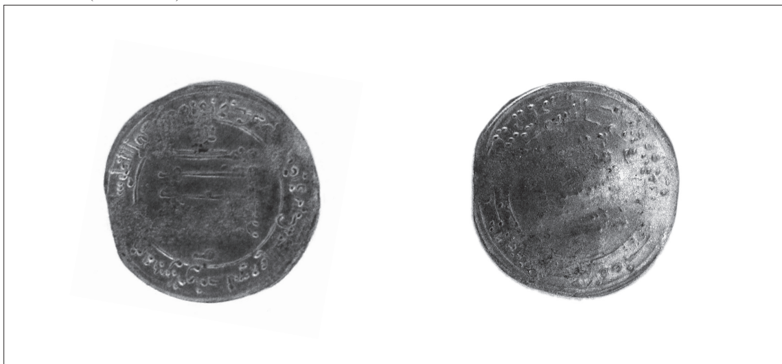
3. N° 92185 (SA n° 92033).