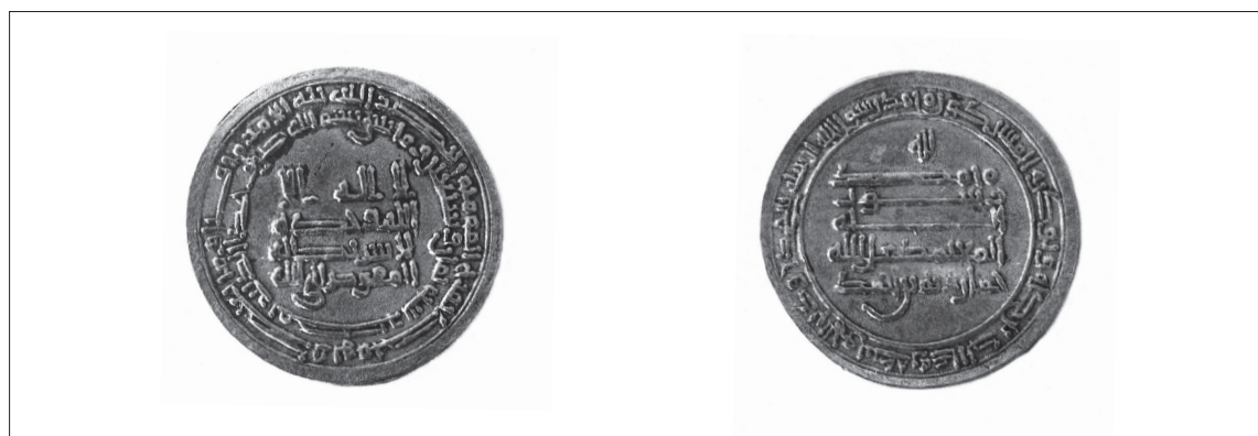
1. N° 98091 (SA n° 98041).

Les pièces datées des premiers Ṭulunides sont relativement rares 9 . Elles témoignent pourtant d'un effort de rationalisation de la frappe monétaire : chaque capitale de province fut dotée d'un atelier de frappe. La situation économique de l'Égypte à cette époque est paradoxale : alors que la province acquérait un degré d'autonomie sans précédent depuis la conquête arabe, son monnayage d'or traversa une crise sévère 10 . Les spécimens présentés ici confirment par leur qualité que cette dévaluation ne s'est pas accompagnée d'une dégradation du type.