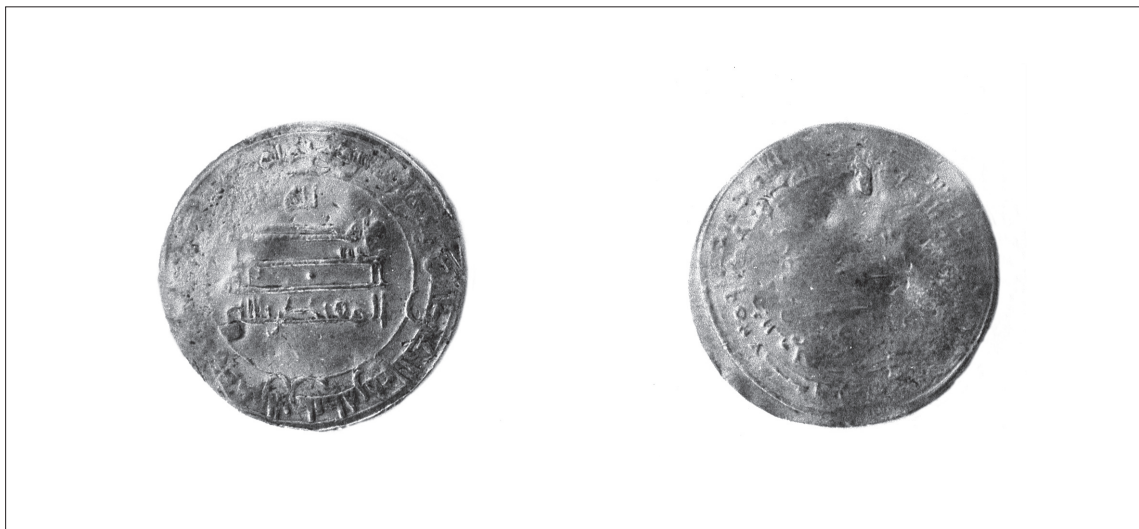
2. N° 98012 (SA n° 98001).