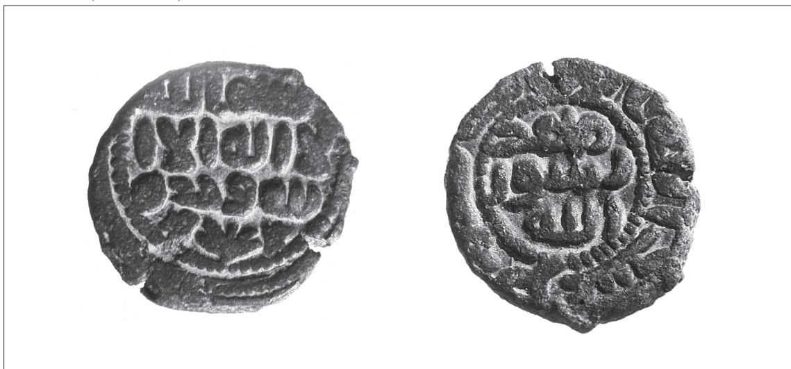
4. N° 89005 (SA n° 8904).