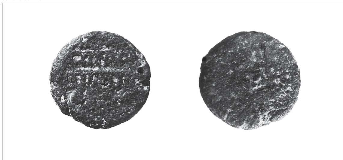
6. N° 89006 (SA n° 8905).