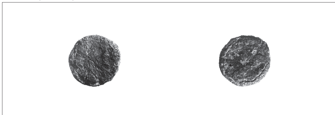
7. N° 89007 (SA n° 8906).