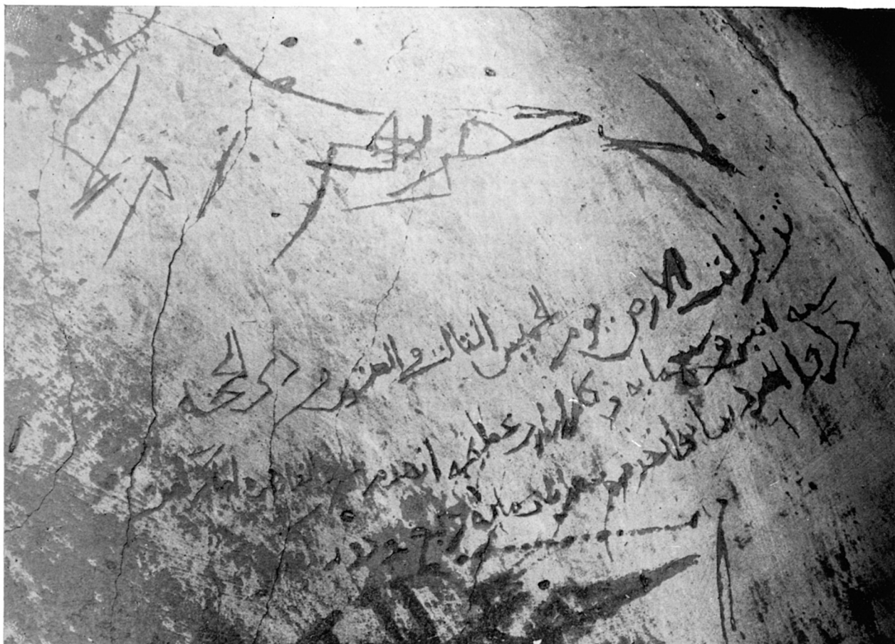
Graffite à droite de l'entrée du tombeau n° 25.