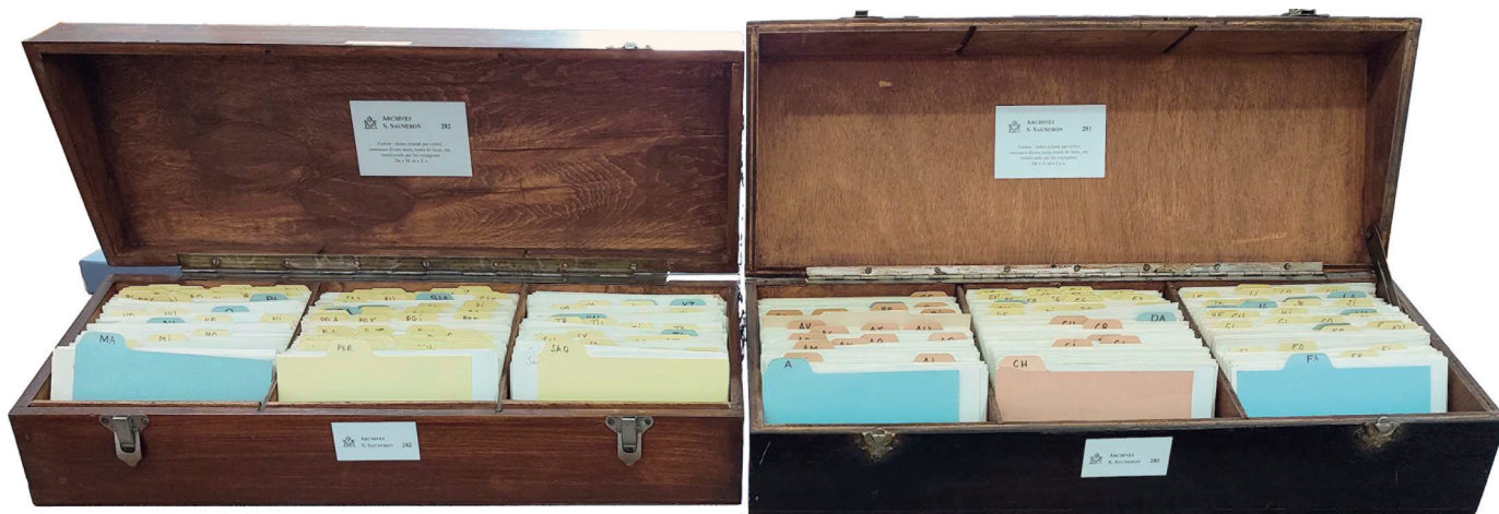
Fig. 3. Boîtes de l'index général classé alphabétiquement de A à L (armoire 18, boîte 281) et de M à Z (armoire 18, boîte 282). Le Caire, Ifao, archives scientifiques.