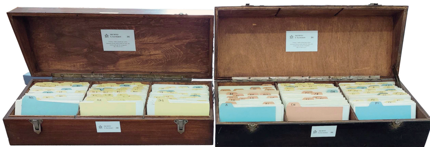
Fig. 3. Boîtes de l'index général classé alphabétiquement de A à L (armoire 18, boîte 281) et de M à Z (armoire 18, boîte 282). Le Caire, Ifao, archives scientifiques.

Gravure inférieure : Norden, F.L., « Vintième partie de la carte du Nil avec ses bords depuis Mahamüd jusqu'à Gascheile », dans The antiquities, natural history, ruins and other curiosities of Egypt, Nubia and Thebes , 1780, Londres.