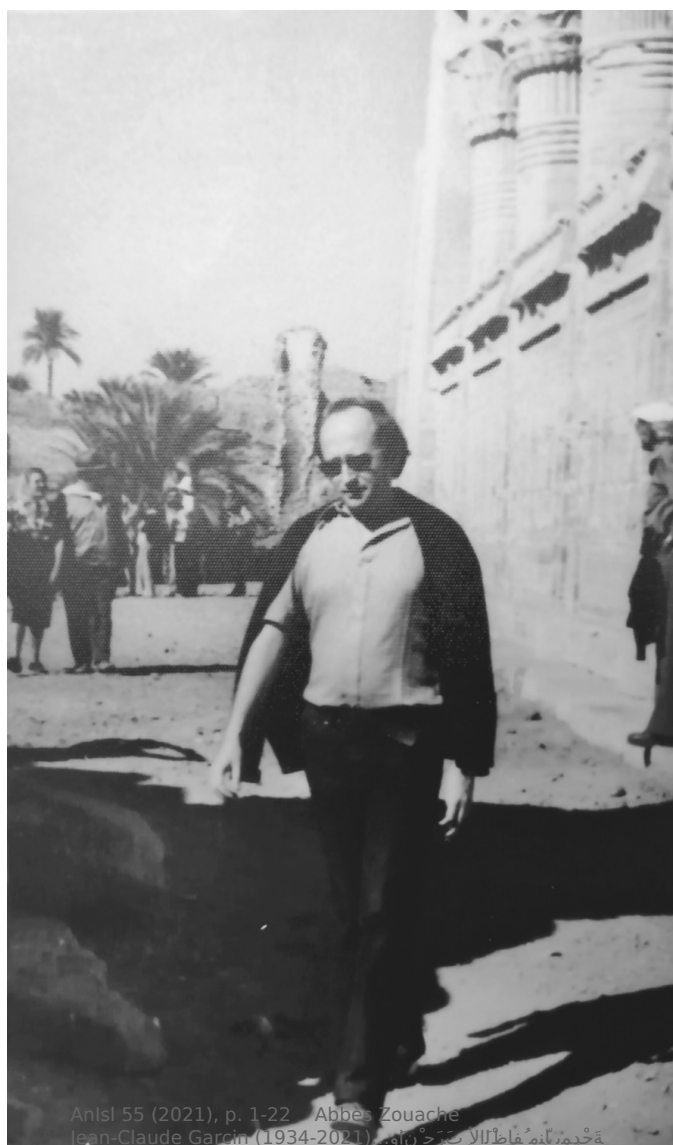
Fig. 8. En Égypte, entre 1970 et 1972. Collection de la famille Garcin. https://www.ifao.egnet.net