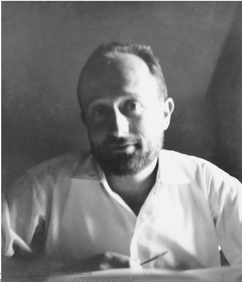
Fig. 6. En Égypte, entre 1963 et 1967. Collection de la famille Garcin.