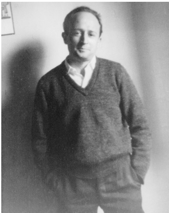
Fig. 3. En Égypte, au début des années 1960.