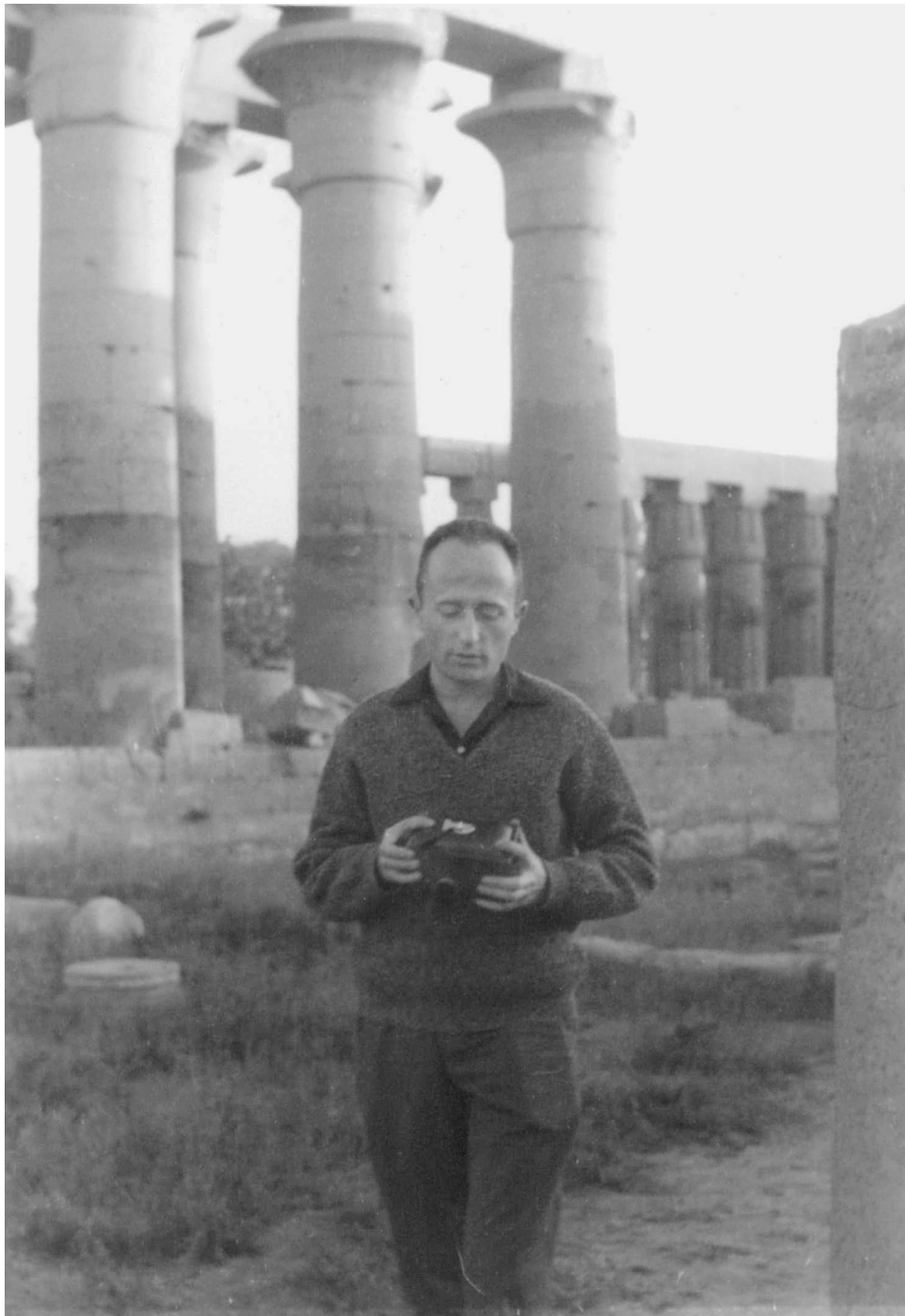
Fig. 2. En Égypte, au début des années 1960.

al-Amer, Ahmad, L'historiographie à l'époque mamelouke à travers l'exemple de l'ouvrage Badā'i' al-zubūr d'Ibn Iyās : analyse de la méthode et du contenu , Thèse de doctorat en Histoire soutenue à Aix-Marseille en 2014.