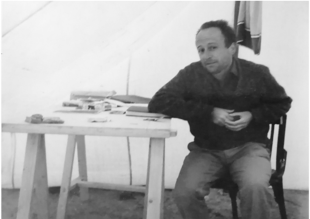
Fig. 5. Fouilles à Kellia, 1963.