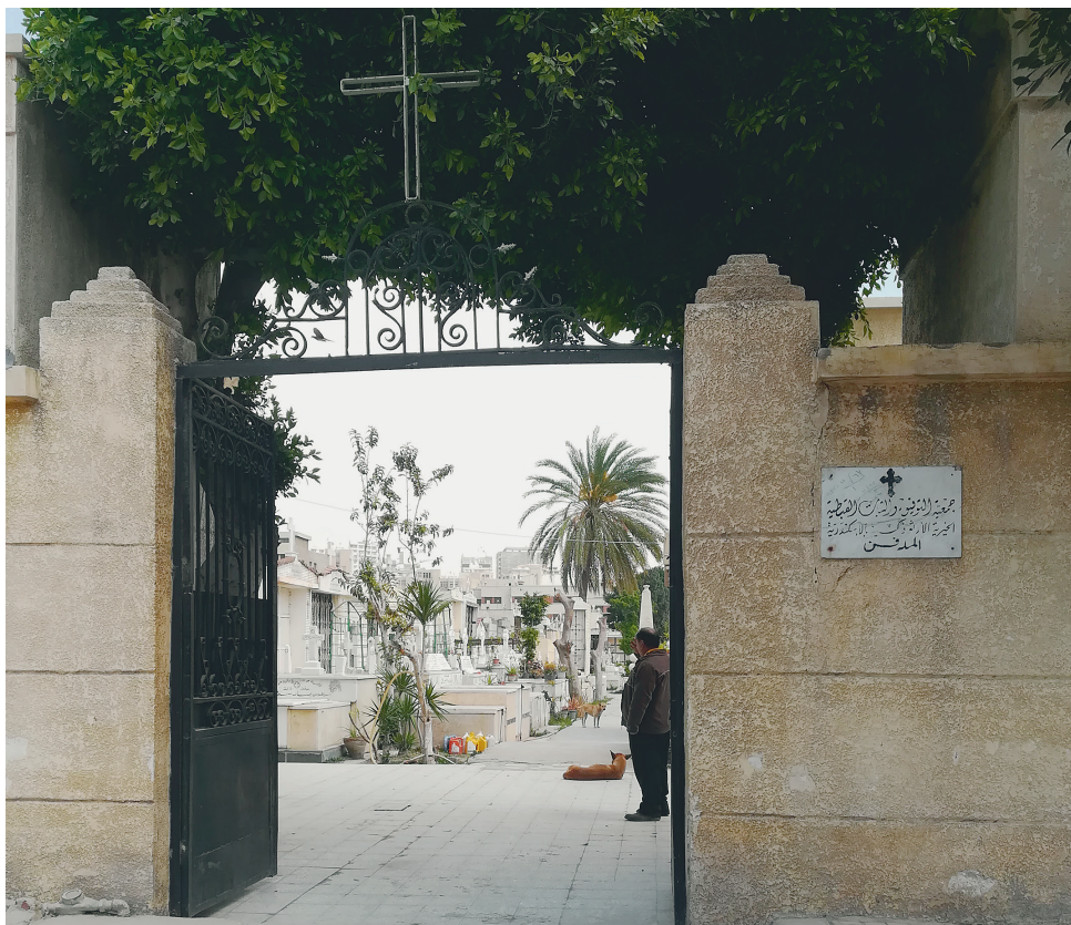
Fig. 1. Entrée de l'ancien cimetière civil d'Alexandrie (photo 2019).