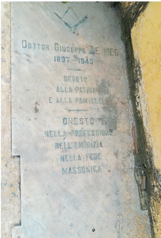
Fig. 3. Tombe d'un franc-maçon dans le cimetière d'Alexandrie (photo 2019).