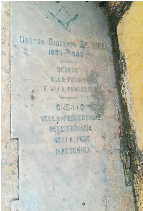
Fig. 3. Tombe d'un franc-maçon dans le cimetière d'Alexandrie (photo 2019).