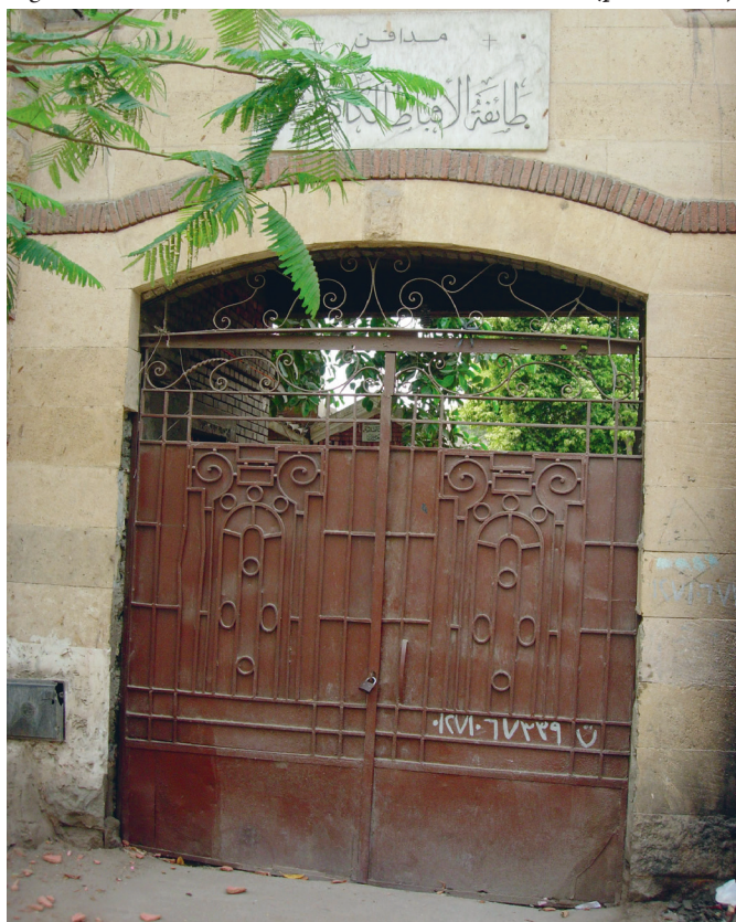
Fig. 2. Entrée de l'ancien cimetière civil du Caire (photo 2019).