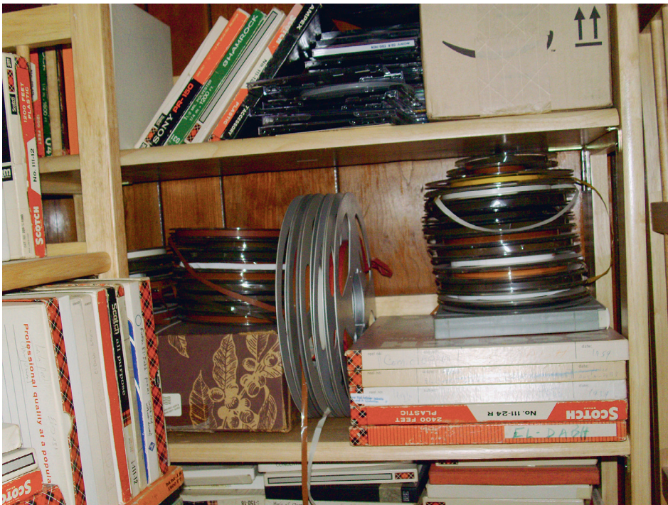
Fig. 2. Photographie des bandes magnétiques conservées au domicile de Halim El-Dabh (cliché envoyé à l'auteur par l'épouse de l'artiste, Deborah El-Dabh).

Ce texte est construit à partir de données plus incomplètes que prévues : rendez-vous était pris avec El-Dabh à son domicile dans le Kent aux États-Unis à l'automne 2017. L'objectif était de numériser ses archives sonores et bien entendu de discuter autant de son parcours que de sa pratique des enregistrements et de leur emploi dans le travail de composition. Des échanges par mail et un entretien en vidéoconférence avaient précédé cette rencontre pour la préparer au mieux. Malheureusement, Halim El-Dabh est décédé le 2 septembre 2017 et notre rencontre est restée suspendue aux mots qu'il me confiait à la suite de l'évocation des sons du Caire contemporain, en conclusion de notre entretien du mois de février 2017, un véritable cri du cœur : « You gave me a desire now and hunger to go back to Egypt right now ! » 11 .