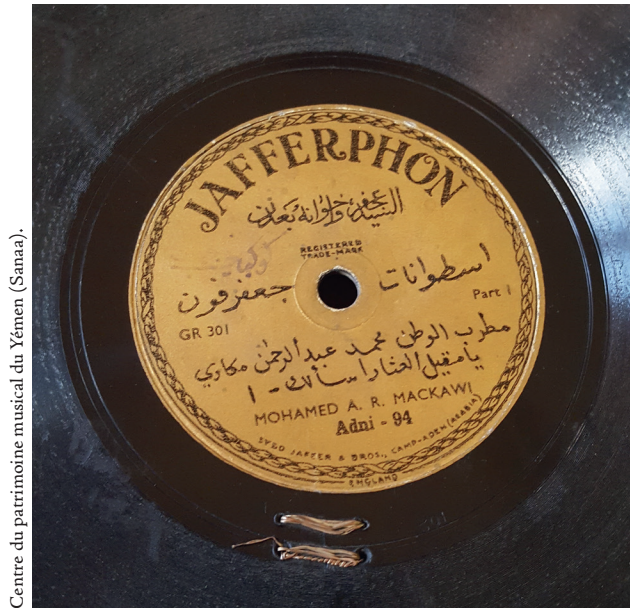
Centre du patrimoine musical du Yémen (Sanaa).