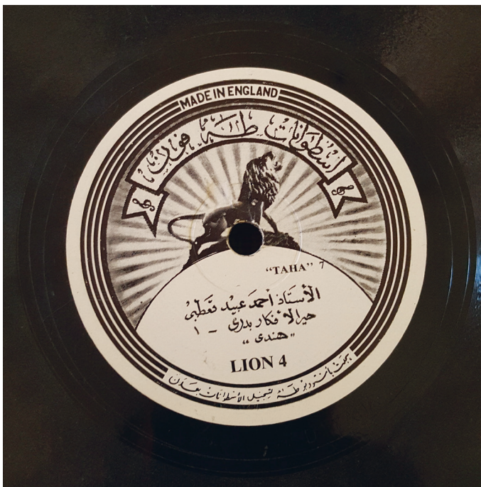
Fig. 14. Tahaphon, Ahmad 'Ubayd al-Qa'tabi, Hayyar al-afkār badri.

Cette pochette contient de la publicité pour un magasin qui vendait non seulement des disques et des phonographes, mais aussi de nombreux articles sans rapport avec la musique : des radios, des pneus, des batteries, des lanternes, etc. Cette diversification des activités commerciales, signe d'une activité prospère, est sans doute l'une des raisons du succès de cette famille hors normes qui réussit à transcender des événements aussi dramatiques que ceux de la guerre dans le domaine de la musique : elle avait une solide assise commerciale. Mais Taha Muhammad Ḥamūd était également propriétaire de plusieurs salles de cinéma (comme son père et son grand-père) et avait fondé plusieurs radios locales qui existaient avant Radio Aden 114 . Les pochettes et les étiquettes de cette compagnie, notamment leur graphisme, indique une période plus tardive que les précédentes, assurément après la guerre : pour la première fois, une compagnie yéménite a un logo figuratif, un lion rugissant, et c'est une photo (fig. 14).