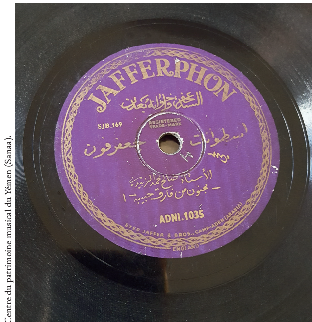
Centre du patrimoine musical du Yémen (Sanaa).