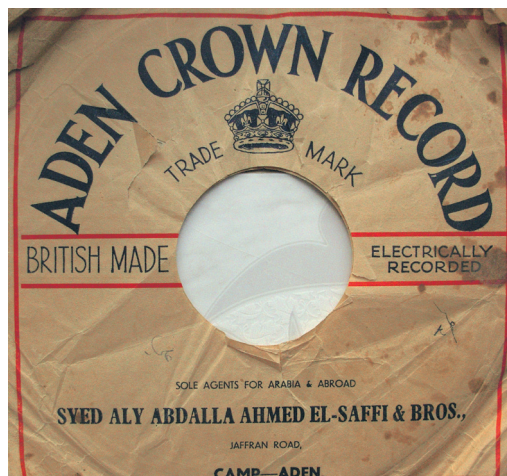
Fig. 4 et 5. Pochettes de disques Aden Crown.

Centre du patrimoine musical du Yémen (Sanaa).