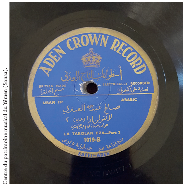
Centre du patrimoine musical du Yémen (Sanaa).