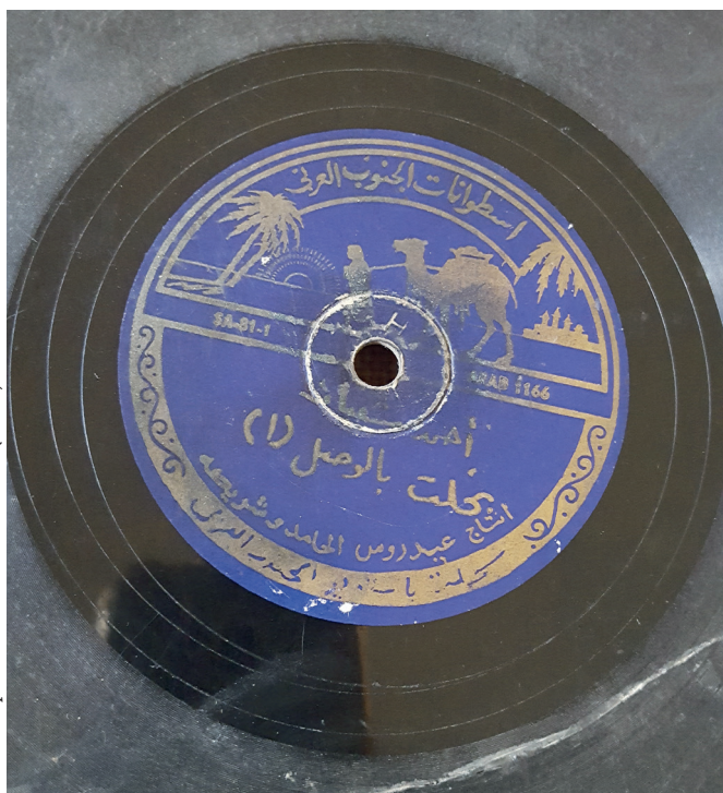
Centre du patrimoine musical du Yémen (Sanaa).