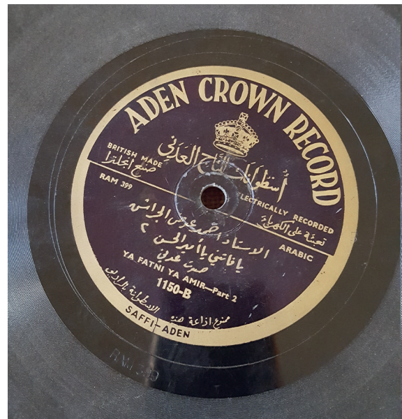
Fig. 6. Aden Crown Record/al-Tāğ al-ʿAdanī, Sāliḥ ʿAbdallāh al-ʿAntarī, Lā taqūlanna idā , ʿadanī. Étiquette bleue.

Centre du patrimoine musical du Yémen (Sanaa).