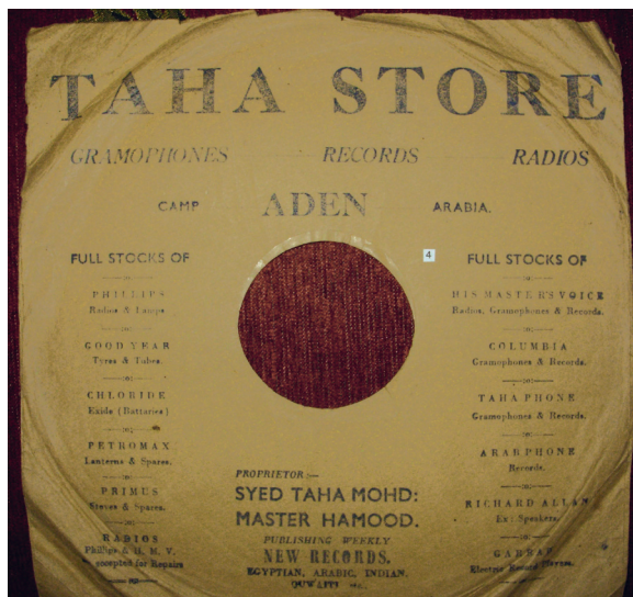
Fig. 13. Pochette de disque, magasins Tahaphon.

Cette pochette contient de la publicité pour un magasin qui vendait non seulement des disques et des phonographes, mais aussi de nombreux articles sans rapport avec la musique : des radios, des pneus, des batteries, des lanternes, etc. Cette diversification des activités commerciales, signe d'une activité prospère, est sans doute l'une des raisons du succès de cette famille hors normes qui réussit à transcender des événements aussi dramatiques que ceux de la guerre dans le domaine de la musique : elle avait une solide assise commerciale. Mais Taha Muhammad Ḥamūd était également propriétaire de plusieurs salles de cinéma (comme son père et son grand-père) et avait fondé plusieurs radios locales qui existaient avant Radio Aden 114 . Les pochettes et les étiquettes de cette compagnie, notamment leur graphisme, indique une période plus tardive que les précédentes, assurément après la guerre : pour la première fois, une compagnie yéménite a un logo figuratif, un lion rugissant, et c'est une photo (fig. 14).