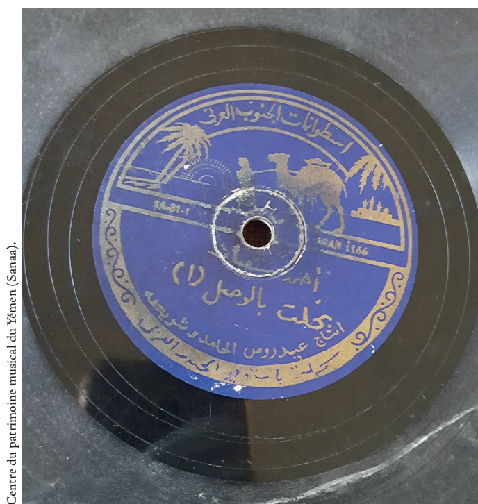
Centre du patrimoine musical du Yémen (Sanaa).

Cette compagnie avait pour propriétaire un personnage mal connu, 'Aydarūs al-Hāmid, dont le nom figure sur les disques Arabian South, et qui était originaire du Ḥaḍramawt (Wādī Dū'an). Les étiquettes sont bleu roi (fig. 16), ce qui rappelle la couleur des étiquettes Kayaphon. Le logo est un chameau qui est conduit par un bédouin dans le désert, avec au loin un palais dont on imagine qu'il évoque les villes historiques du Ḥaḍramawt.