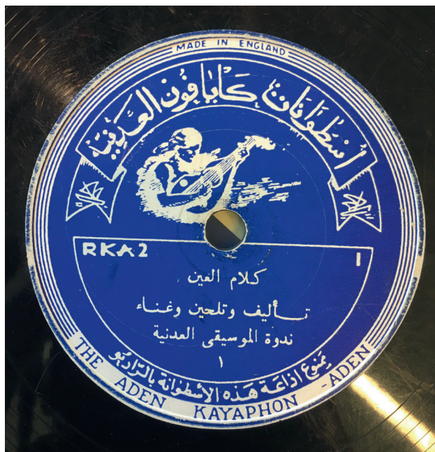
Fig. 15. Disque Kayaphon, Kalām al-'ayn , sans nom d'interprète.

Les numéros des disques suivent l'abréviation RKA, probablement pour Record Kayaphon Aden. Les étiquettes sont bleu roi. Toujours selon l'esprit militant du Club, ses fondateurs se refusaient de faire figurer le nom du musicien sur chaque disque. C'est ainsi que le disque Kalām al-'ayn (RKA 2) (fig. 15) n'a pas de nom d'interprète, alors que l'on sait par ailleurs que ce dernier était Ḥalīl Muḥammad Ḥalīl 125 .