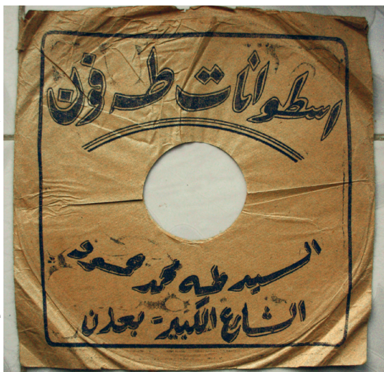
Fig. 12. Pochette de disque Tahaphon.