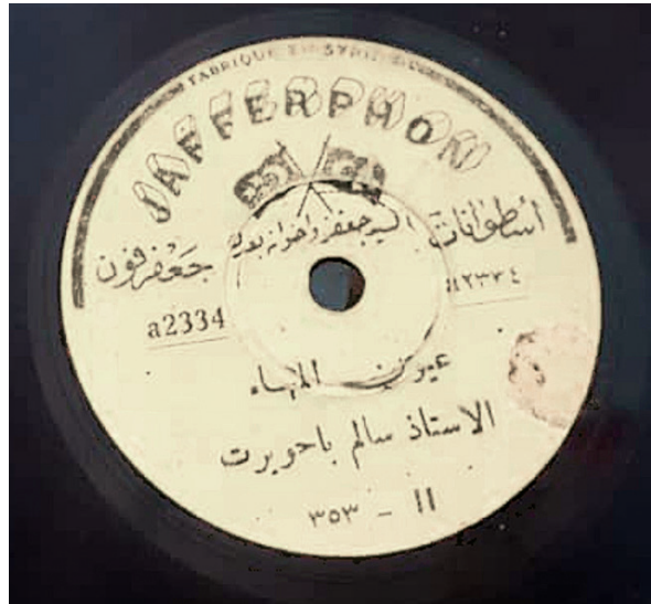
Fig. 10. Jafferphon, Sālim Bā Ḥuwayrit, ‘ Uyūn al-mahā (période Alep).