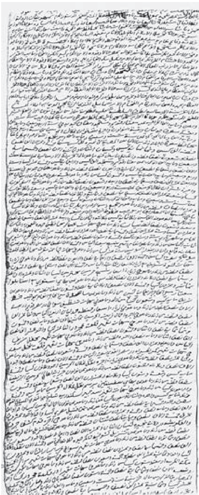
لوحة رقم ٣. وثيقة رقم ٧٣ صفحة ٤٩ و ٥٠ بتاريخ ٣ رجب ١١٧٩ هـ الديوان العالي سجل رقم (٢) (صفحة رقم ٤٩).