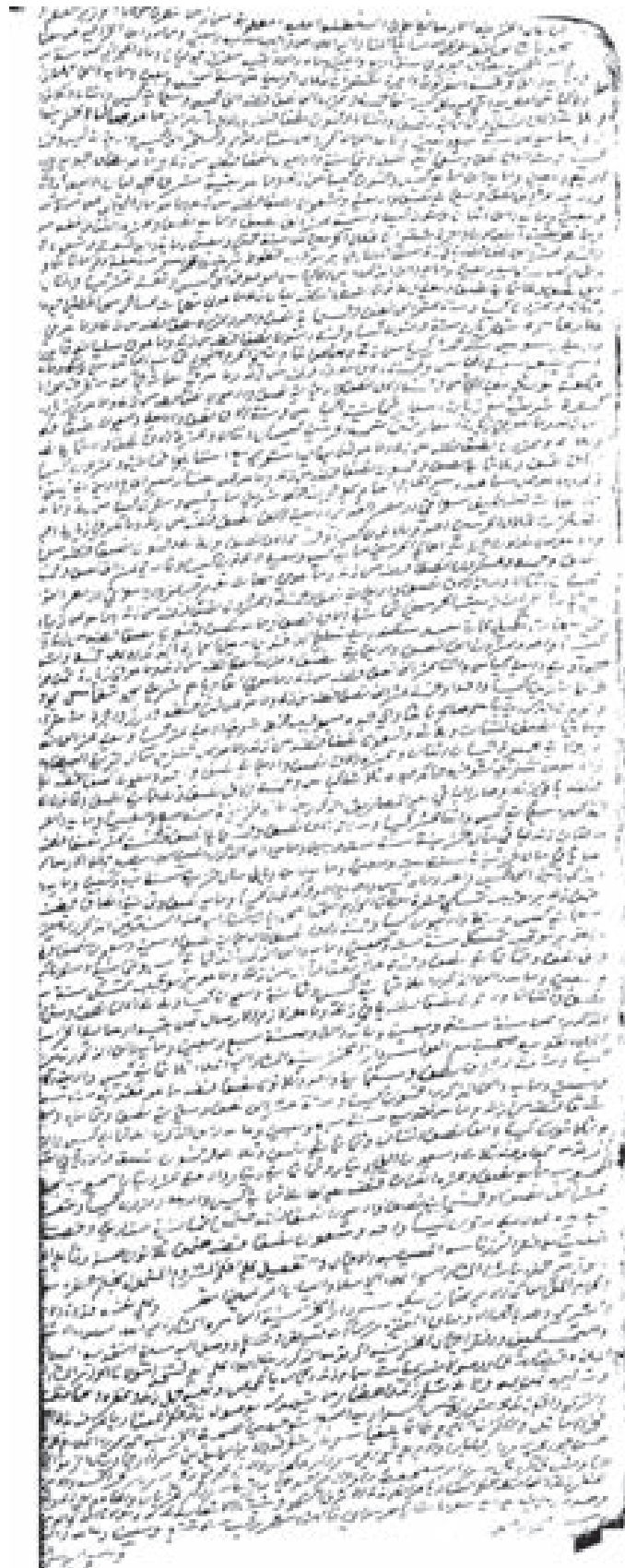
تابع لوحة ٣. الديون العالي سجل رقم (٢) (صفحة رقم ٥٠).