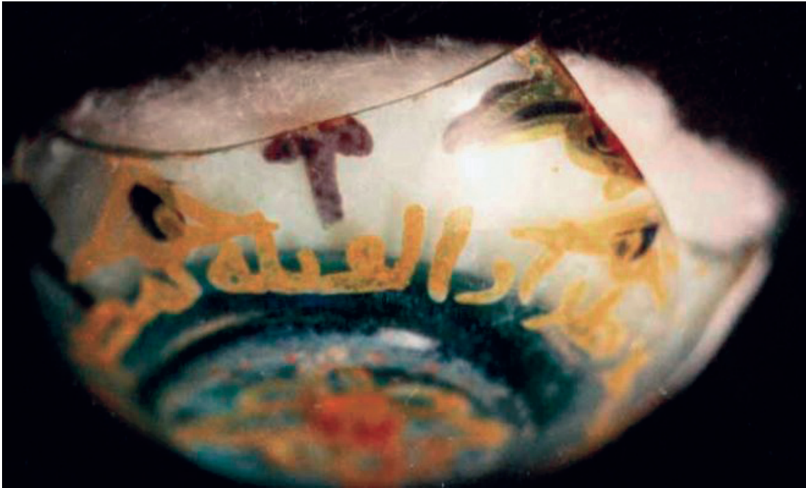
اللوحة رقم (٢). بقايا صحن مزين بآداب البريق المعدني-متحف الفن الإسلامي.