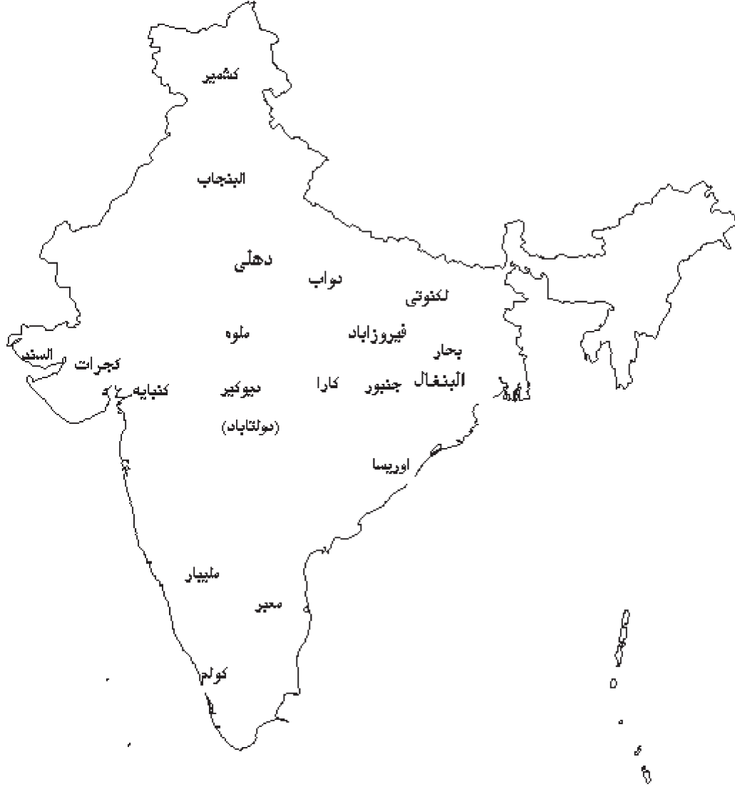
شكل ٣. خريطة لأهم مدن الهند خلال عصر آل تغلق.