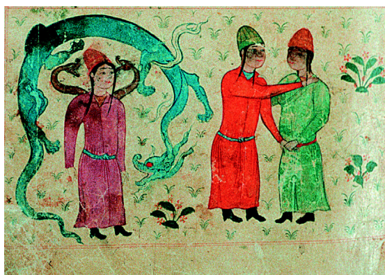
8. Le signe des Gémeaux (f° 25r°).