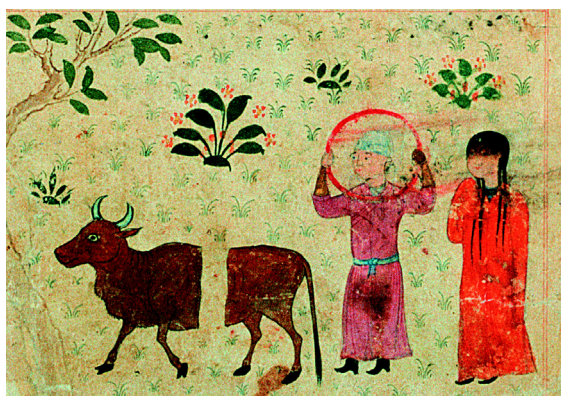
7. Le signe du Taureau (f° 24v°).