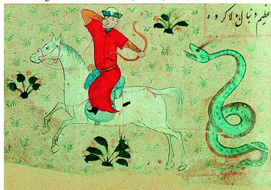
14. Le signe du Sagittaire (f° 27r°).