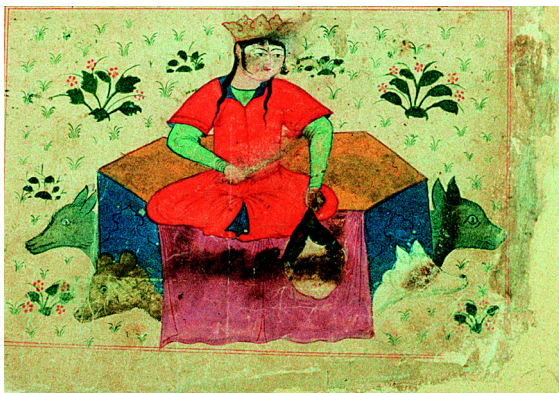
1. Mars (f° 22v°).