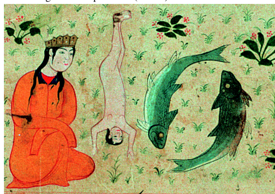
17. Le signe des Poissons (f° 28v°).