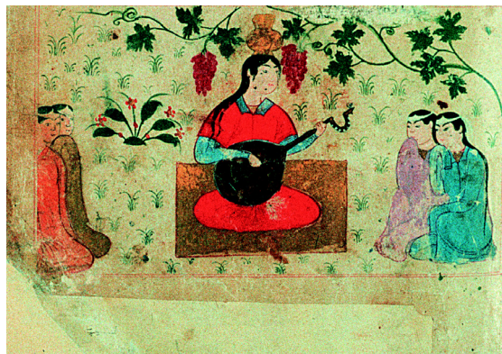
2. Vénus (f° 23r°).