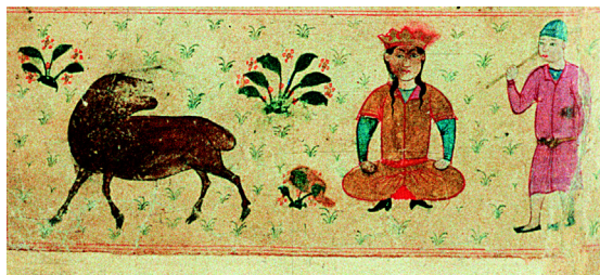
6. Le signe du Bélier (f° 24r°).