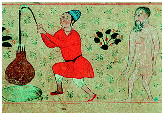
16. Le signe du Verseau (f° 28r°).