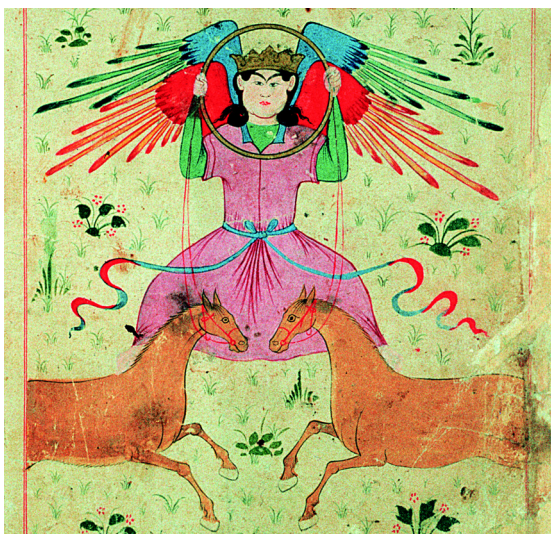
5. Soleil (f° 21v°).