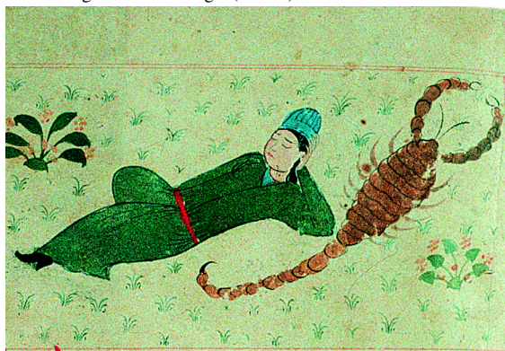
13. Le signe du Scorpion (f° 27r°).