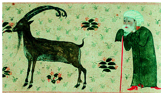
15. Le signe du Capricorne (f° 28r°).