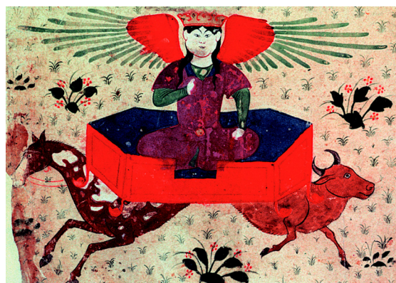
4. Jupiter (f° 22r°).