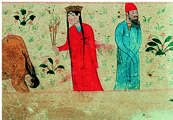
11. Le signe de la Vierge (f° 26r°).