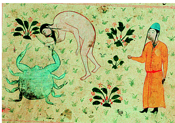
9. Le signe du Cancer (f° 25v°).