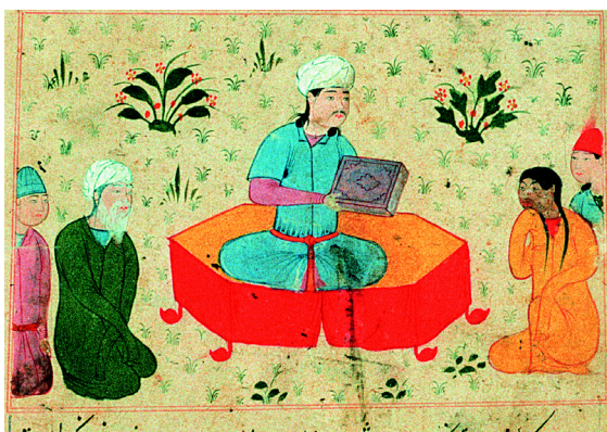
3. Mercure (f° 23v°).