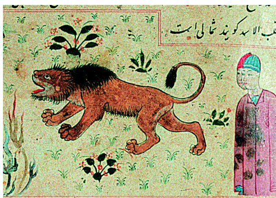
10. Le signe du Lion (f° 26r°).