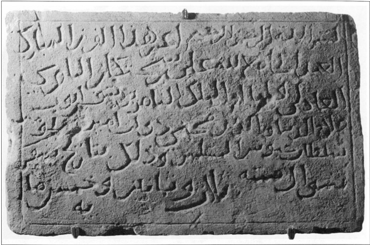
Fig. 3. Ins. n° 1.