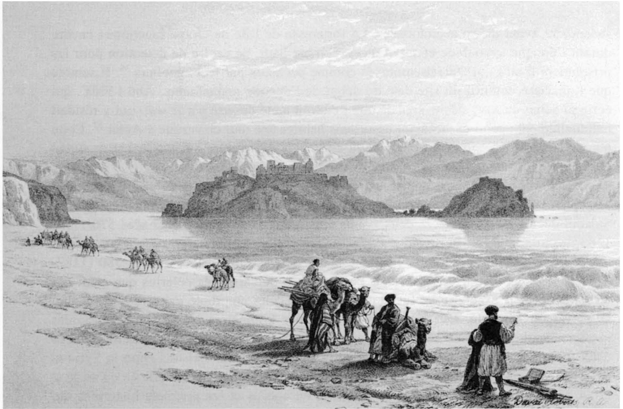
Fig. 1. L'île de Graye d'après D. Roberts. (Cl. J.-Fr. Gout).