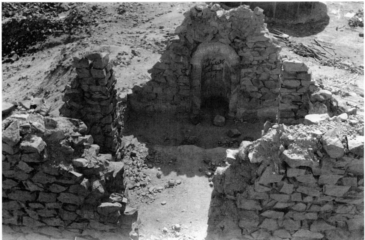
Fig. 2. Mosquée de l'île de Graye.