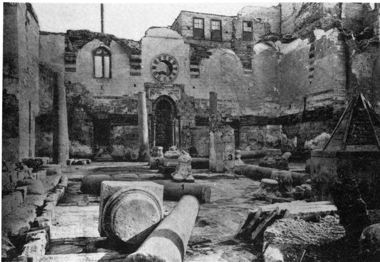
... (d'après CCMAA fasc. 20, 1903, pl. IV et V).