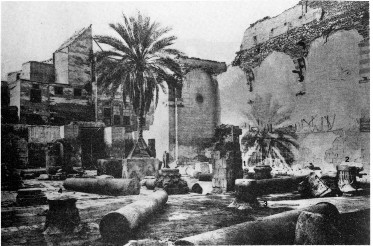
Fig. 2. — Mosquée Sūdūn Min Zāda...