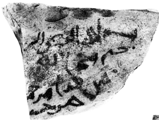
N° 1130. A1, c20.