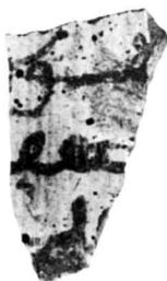
N° 578. A1, c6, S.