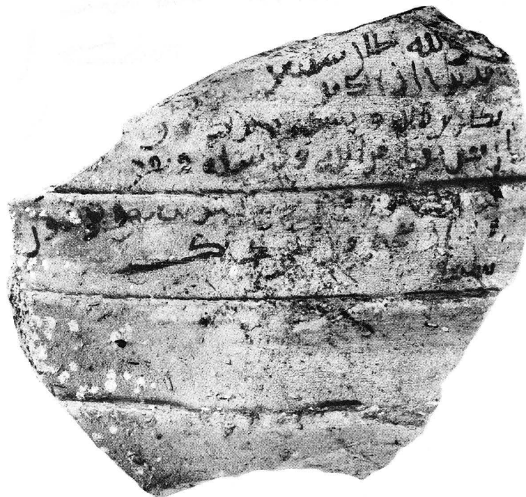
N° 744. C3, c6.