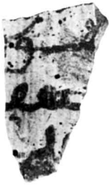
N° 578. A1, c6, S.