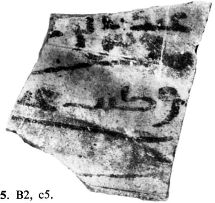
N° 1105. B2, c5.