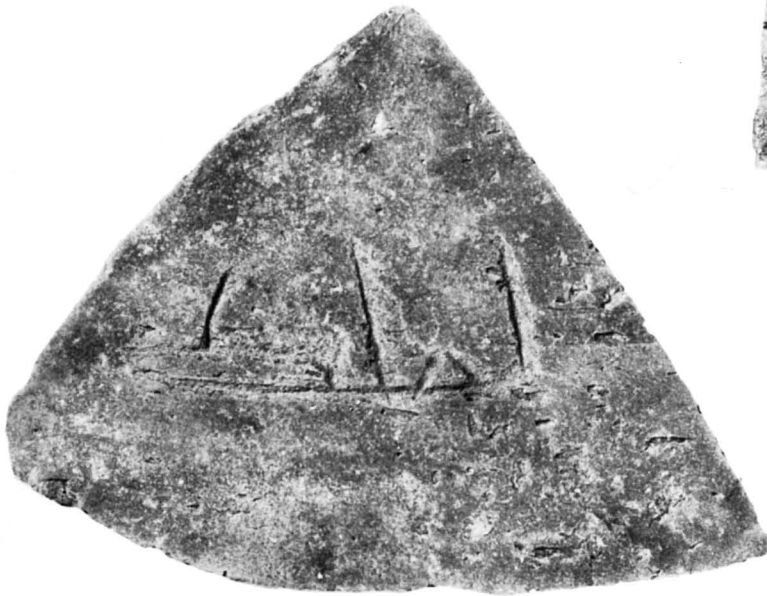
N° 1405 (2). C3, c7.