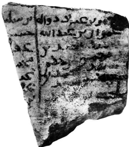
N° 102 (2). Ramassage de surface S-E.