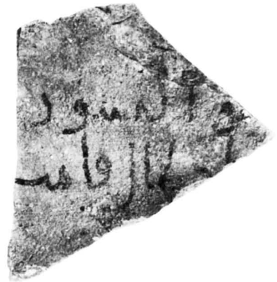
N° 1405 (1). C3, c7, N.