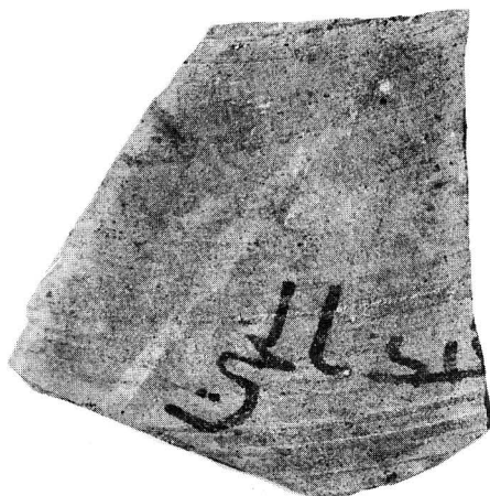
N° 482. C3, c4.