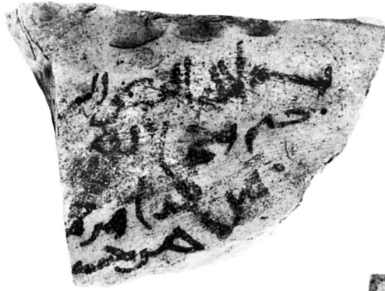
N° 1130. A1, c20.