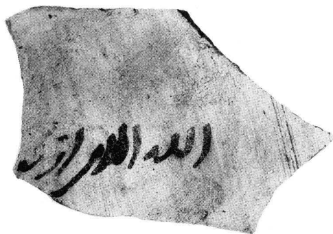
N° 102 (1). Ramassage de surface.