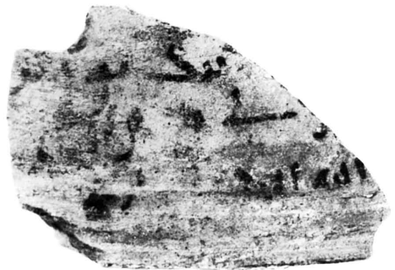
N° 708. C3, c9.