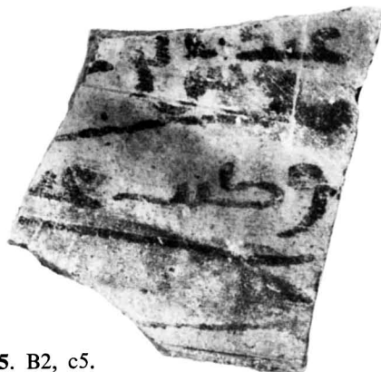
N° 1105. B2, c5.