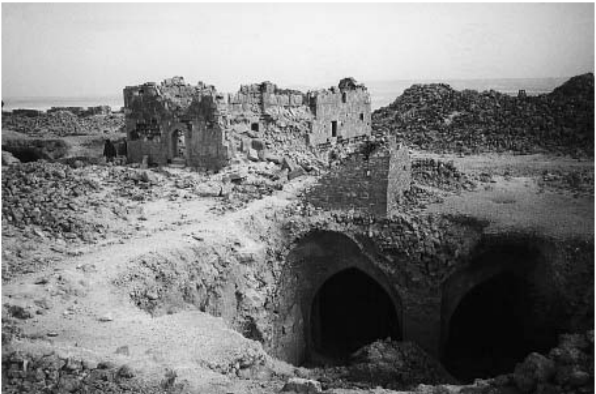
Fig. 15. Qal'at al-Guindi. La grande mosquée et les citernes.

En ce qui concerne le programme sur l'eau, Cl. Piaton a entrepris cette année le relevé des structures en place du hammam situé dans l'angle sud-est de la forteresse. Le hammam occupe l'angle nord-est d'un ensemble bâti de plan quasi carré d'environ 25 m de côté et au centre duquel se trouve un oratoire privé : il est fort probable que ce complexe était la résidence du gouverneur de la forteresse. En l'état actuel, cinq pièces disposées en enfilade, selon le schéma classique d'un bain, ont été identifiées. Quatre d'entre elles dont la surface varie de 2 à 6 m 2 , ont conservé leur plafond voûté. La cinquième d'environ 4 m 2 , était couverte par une toiture terrasse portée par une poutraison de bois aujourd'hui effondrée. En l'absence de fouille, l'affectation des pièces ne peut être établie avec certitude. La présence de canalisations en terre cuite dans les parois et de bassins dans le sol de deux des pièces voûtées permet cependant de les identifier comme les salles principales du bain. Le mur ouest de l'une de ces pièces est percé d'un trou carré de 10 cm de côté par lequel arrivait probablement la vapeur d'eau. L'existence de cette liaison avec d'autres pièces nous permet de formuler l'hypothèse d'une localisation des