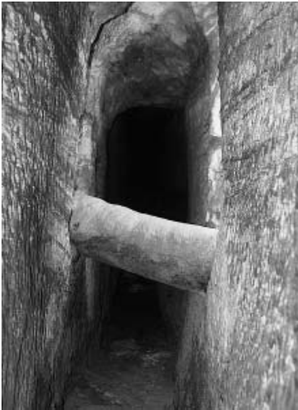
Fig. 6. Croisement des qanâts MQ5 et MQ4. Un tuyau en céramique permet aux eaux collectées dans la qanât MQ4 de franchir la galerie de MQ5, creusée plus bas.

pas du tout à celle des regards de la qanât 4, mais plutôt à celle d'un regard de la qanât 5. La galerie de MQ4 aboutit latéralement dans ce regard. D'autre part, c'est l'allongement en direction de l'ouest de la galerie de MQ5 qui a provoqué ce croisement. Enfin, le conduit de MQ4 entre R1 et R0 présente un tracé très curviligne qui ne correspond pas aux pratiques courantes des ouvriers qui ont creusé les qanâts . On proposera donc le schéma suivant de développement des parties terminales de ce réseau : dans un premier temps, la qanât MQ5 se termine presque au niveau du croisement (à l'endroit où se trouve le ressaut du plafond) alors que la qanât MQ4 se termine à la fin des encroûtements ferreux visibles sur les parois ; ensuite, la qanât MQ4 est allongée en évitant soigneusement le terminus de MQ5. MQ5 est ultérieurement allongée et ne peut plus alors éviter la jonction avec la qanât MQ4. Cette hypothèse de fonctionnement devra être confirmée par l'étude de détail que nous mènerons au cours de la campagne 2002.