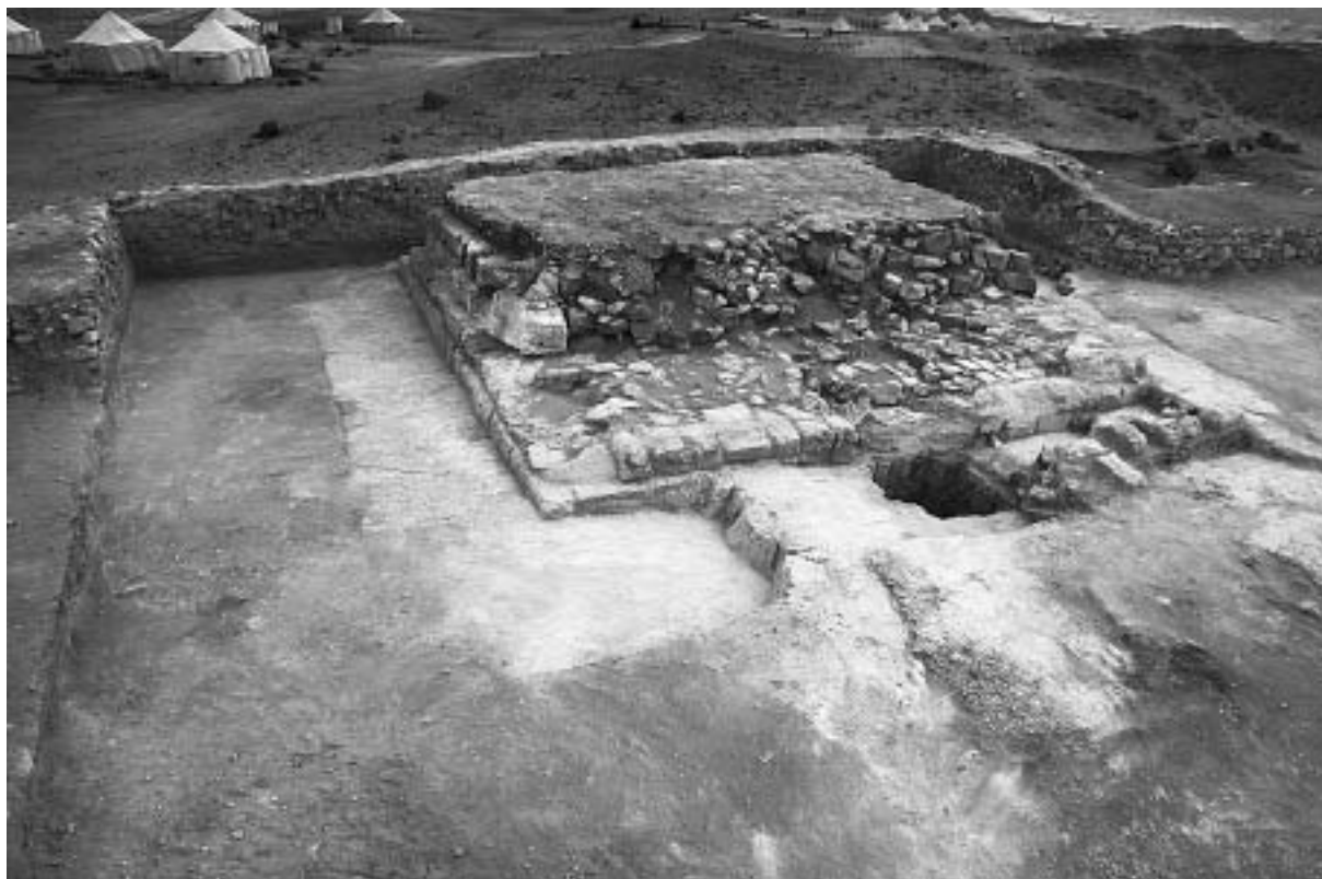
Fig. 1. Abou Roach. Complexe de Rêdjédef. La pyramide satellite de l'angle sud-est.

La superstructure de cette construction épouse un plan carré d'environ vingt coudées de côté (10,50 m), actuellement conservée sur une hauteur de cinq assises (environ 1,85 - 2,05 m). L'inexistence de puits, dans cette superstructure et l'absence de niches (ou chapelles) aménagées sur la façade orientale, caractéristiques des mastabas classiques, invitaient à écarter cette possibilité. En revanche, l'aménagement de murs, construits sur les diagonales du carré de base et l'appareillage, en façade, d'assises verticales, bâties en gradins, suggéraient plutôt le volume d'un tétraèdre. On observera cependant que le dégagement du lit de fondation, posé à même le calcaire natif, n'a pas montré la présence d'une engravure pour y assujettir un éventuel placage de revêtement. De surcroît, aucune trace de ravalement n'a, pour l'instant, été relevée sur les assises conservées.