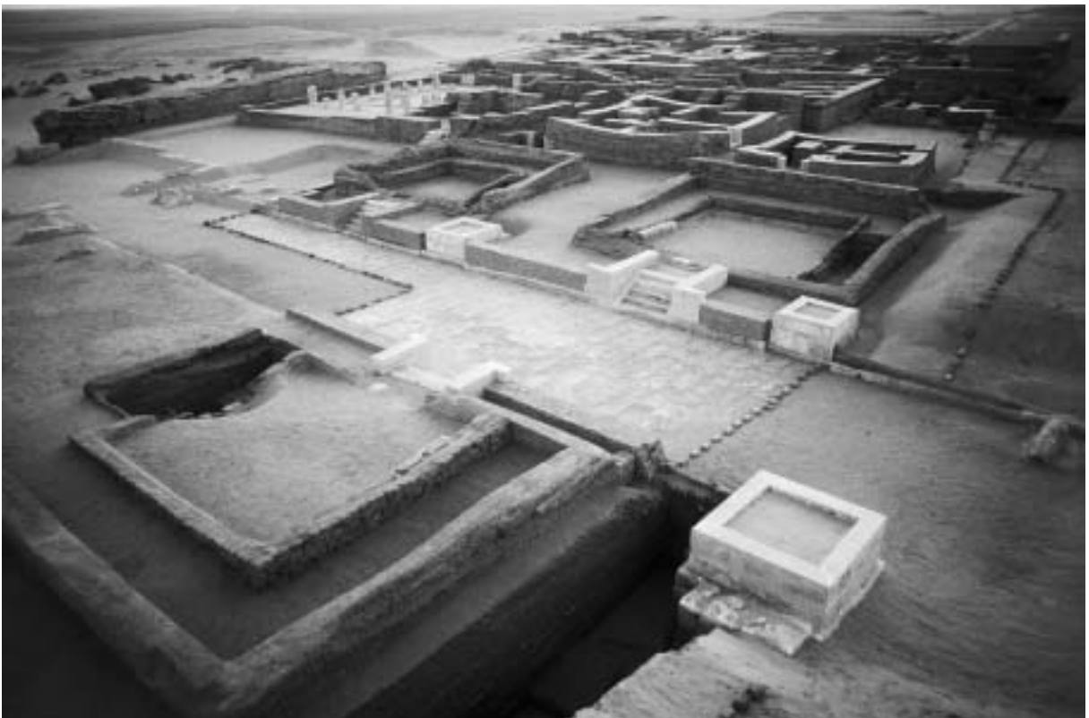
Fig. 14. Tebtynis (Umm-al-Breigât). Vue d'ensemble du dromos et des deipneteria .