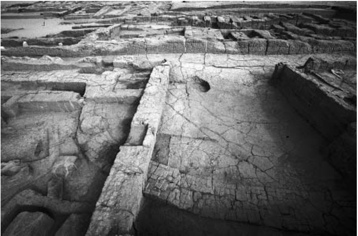
Fig. 9. 'Ayn-Asil. Palais des gouverneurs du règne de Pépy II. Arase du mur d'enceinte premier; vue W/E.

Par ailleurs, la restauration du naos du sanctuaire de ka de Médou-néfer a été achevée. Des travaux de consolidation et de présentation ont été effectués sur la nécropole de Qila el-Dabba, en particulier la restitution du sol de la superstructure du mastaba I.