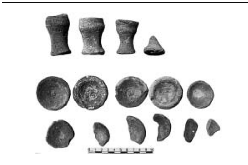
Fig. 12. Complexe funéraire de Djedkarê-Isési. Lot de céramiques miniatures complètes.

À l'extérieur de la pyramide, la consolidation des blocs des gradins internes a été poursuivie sur la face nord, afin de préparer le nettoyage des gradins et des blocs d'appui. Les déblais accumulés au cours de la saison 2001 ont été enlevés et évacués loin du plateau du complexe funéraire.