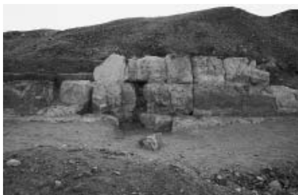
Fig. 3. Abou Roach, nécropole « F ». Mastaba F38.

Le premier monument, provisoirement baptisé F38, est un simple massif à niches extérieures, y compris pour la chapelle principale [fig. 3]. Cette caractéristique suffit à lui assurer une date sous la IV e dynastie, et l'on peut même s'étonner, pour une nécropole