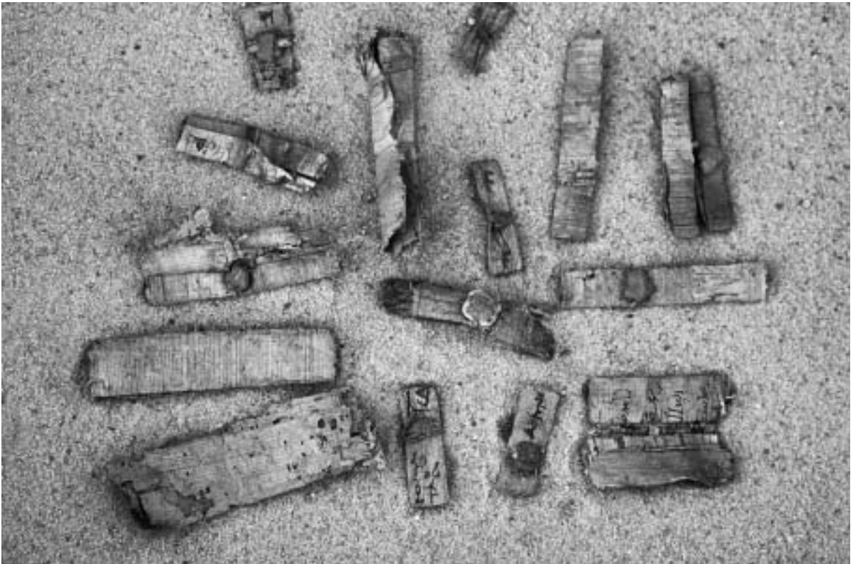
Fig. 13. Tebtynis (Umm-al-Breigât). Papyrus enroulés et scellés du dépotoir.