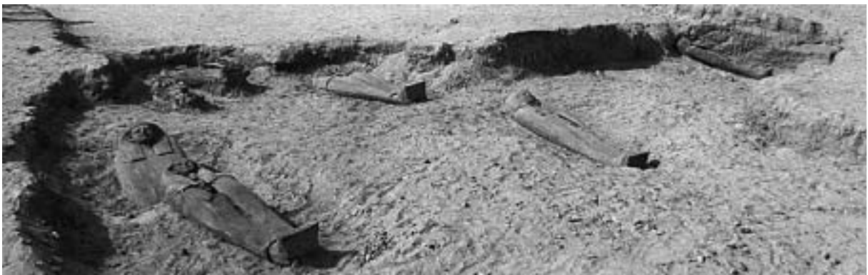
Fig. 11. Tabbet al-Guech. Découverte in situ de six sarcophages anthropoïdes en bois.

Les tessons de poteries recueillis au cours des saisons 2000 et 2001 ont fait l'objet d'une étude préliminaire effectuée dans le magasin du Csa par C. Defernez.