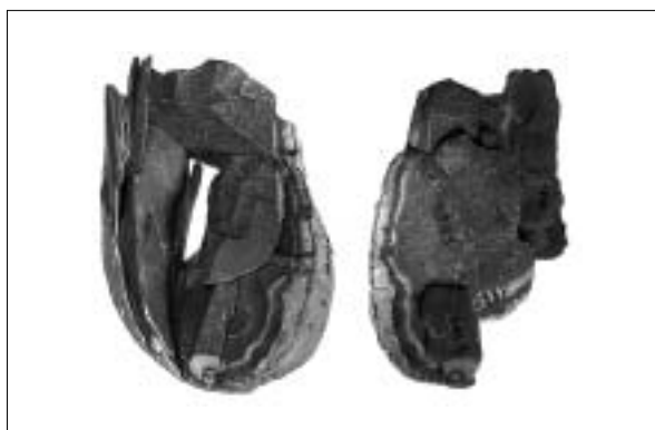
Fig. 5. Étude de la concentration lithique ML1. Remontage d'un nucleus à lamelles.

La composante microlithique est dominante dans l'assemblage de ML1 [fig. 5]. Elle comprend par ordre décroissant des triangles scalènes allongés en écrasante majorité, des fragments de microlithes, ébauches ou pièces déviées attestant du façonnage des armatures microlithiques sur place et corroboré par la présence de nombreux microburins, des lames et lamelles à dos abattu, des triangles scalènes courts, des pointes triangulaires à base non retouchées, des pointes par troncature oblique