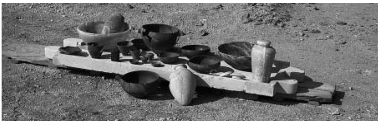
Fig. 2. Abou Roach. Complexe de Rêdjédef. Mobilier funéraire retrouvé dans la pyramide satellite.

La troisième chambre de cet appartement, creusée au sud-ouest du couloir central, avait servi de magasin. Un dépôt de céramiques, en terre cuite, réunissait de grandes jattes, des bols, des coupes, des vases tronconiques, globulaires, des jarres et coupelles, à côté de vases miniatures. Le mur du fond de la pièce présentait deux zones distinctes : une moitié de la paroi avait été taillée dans le calcaire de la montagne ; tandis que la seconde partie avait été enduite de mortier, sur toute la hauteur de la chambre. Le retrait de ce crépi fit apparaître un blocage de pierraille, derrière lequel s'ouvrait un nouveau puits (dim. max. 1,50 × 1,50 m), entièrement comblé d'éclats de calcaire. La fouille de cette cheminée se prolongea jusqu'à une profondeur d'environ 4 m, révélant des parois légèrement tronconiques venant s'interrompre sur le gebel. Vraisemblablement inachevé, ce puits n'a livré aucune trace d'accès à une chambre profonde.