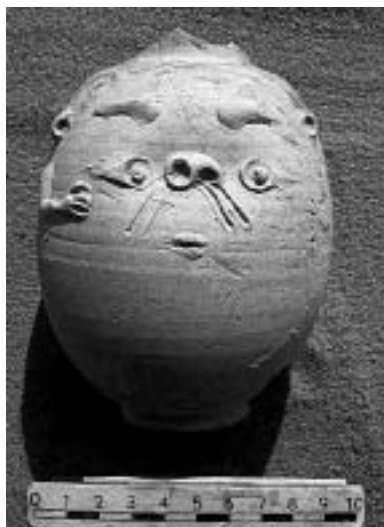
Fig. 10. Tabbet al-Guech. Vase Bès.

Le sondage D de la saison 2000 ayant révélé l'angle nord-est d'un mur en briques crues épais d'environ 60 cm, il a été décidé de rechercher, pendant la saison 2001, ses dimensions, afin de permettre de comprendre sa fonction. Les travaux de dégagement ont été entrepris à 30 m à l'est de la structure, en suivant, d'est en ouest, une couche archéologique horizontale composée de sable éolien, de galets et des tessons ; cette couche reposait sur une accumulation importante de sable compacté ( tafla ).