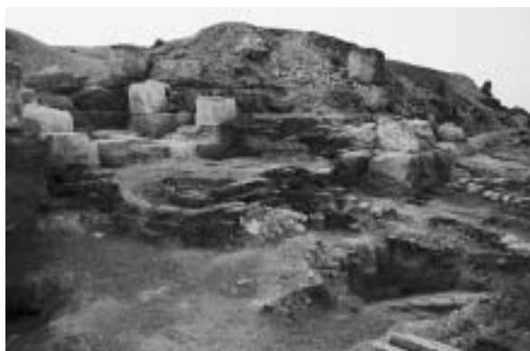
Fig. 4. Abou Roach, nécropole « F ». Mastaba F37.