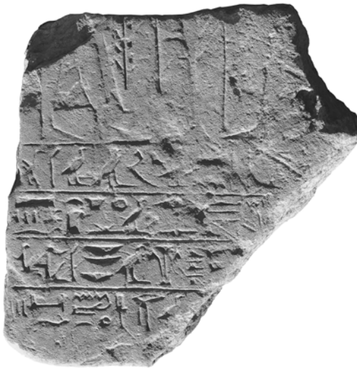
FIG. 1A.

Le contexte archéologique de cette stèle fragmentaire est riche en tessons de céramique et en empreintes sur des bouchons de jarres et d'autres supports 5 , que l'on peut situer dans une fourchette chronologique allant du règne d'Hatchepsout à celui d'Amenhotep III ou IV. Dans la partie du dépotoir dégagée au cours des campagnes 2013-2014 et 2014-2015, les empreintes attribuables aux règnes d'Amenhotep II et III sont les plus fréquentes.