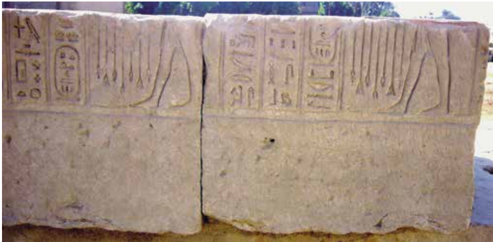
B. Salle XVII Paroi ouest. Inscriptions 89-90 (noms 10 et 11).