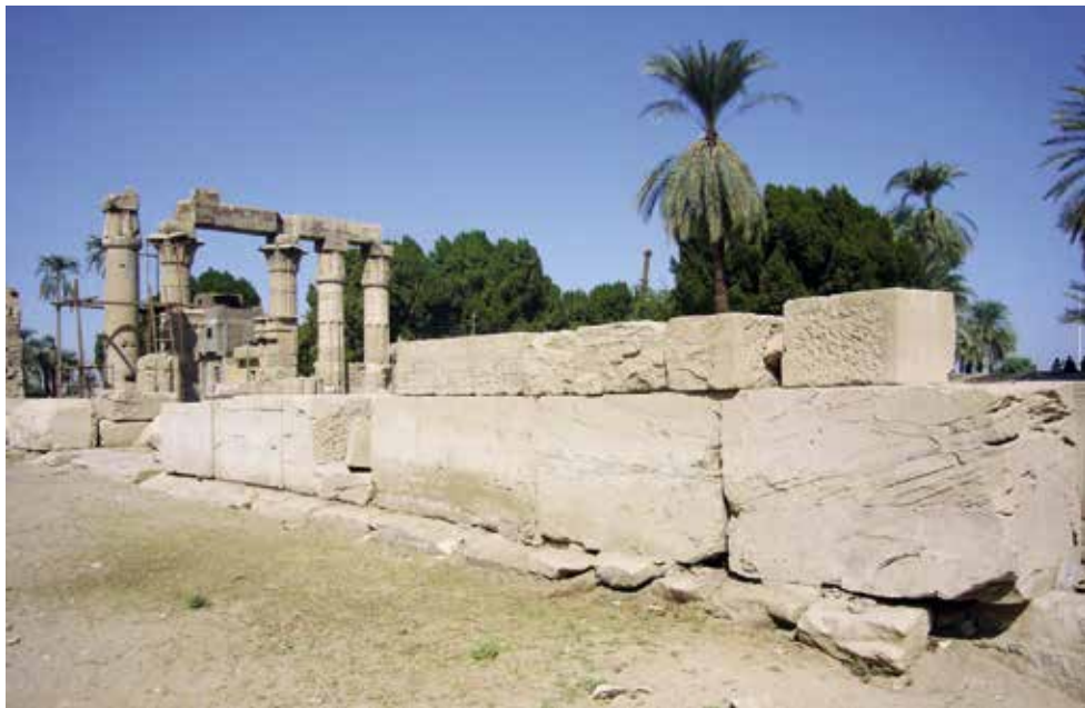
C. Blocs de la ouabet présentés sur le mur péribole d'enceinte.