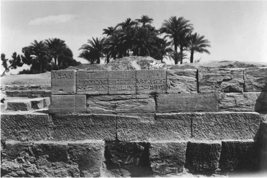
A. Salle XVI. Paroi est. Inscriptions 69-77.