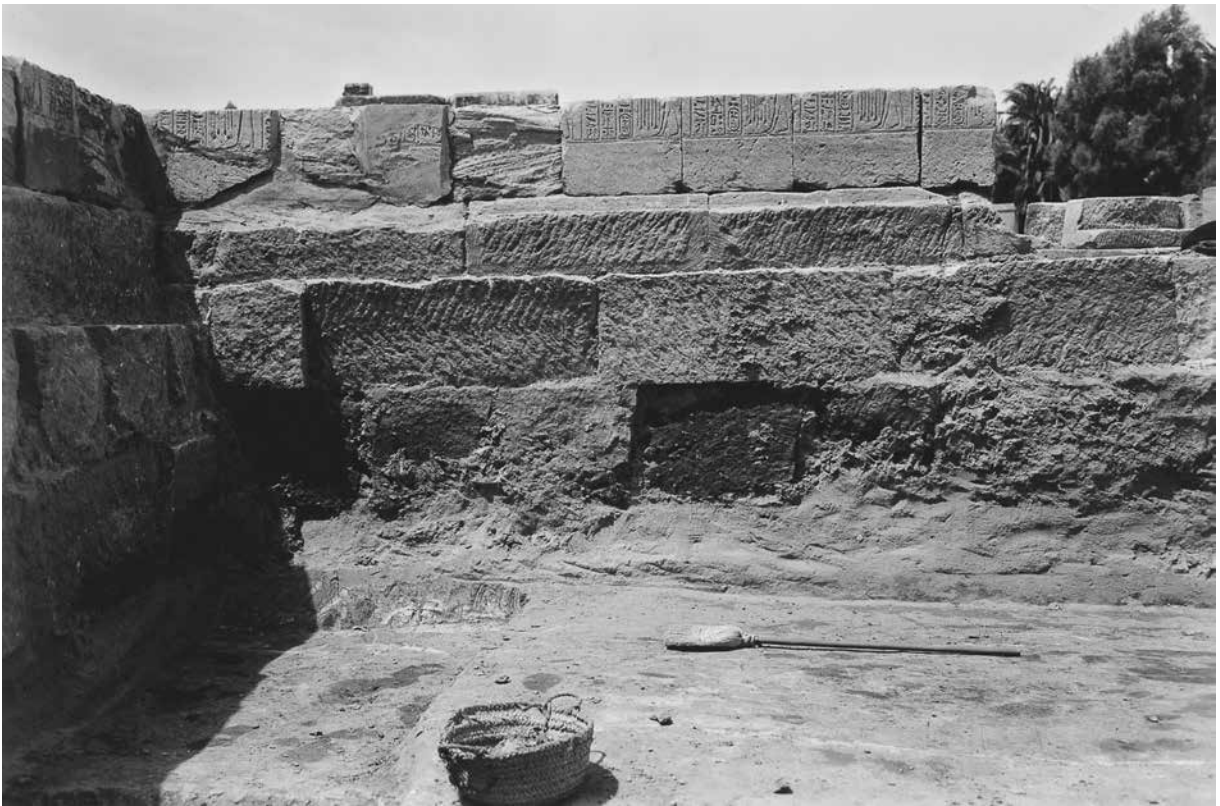
B. Salle XVII. Paroi ouest. Inscriptions 86-91.