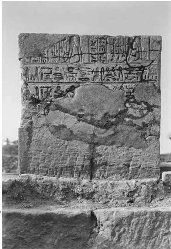
B. Salle XVI. Paroi sud. Inscription 80.