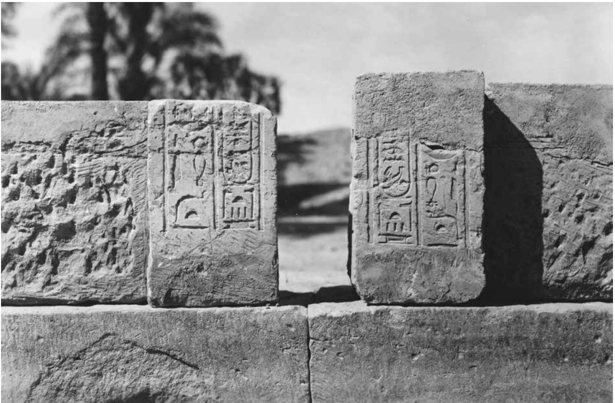
A. Salle XXI. Porte. Façade, inscriptions 64-65.