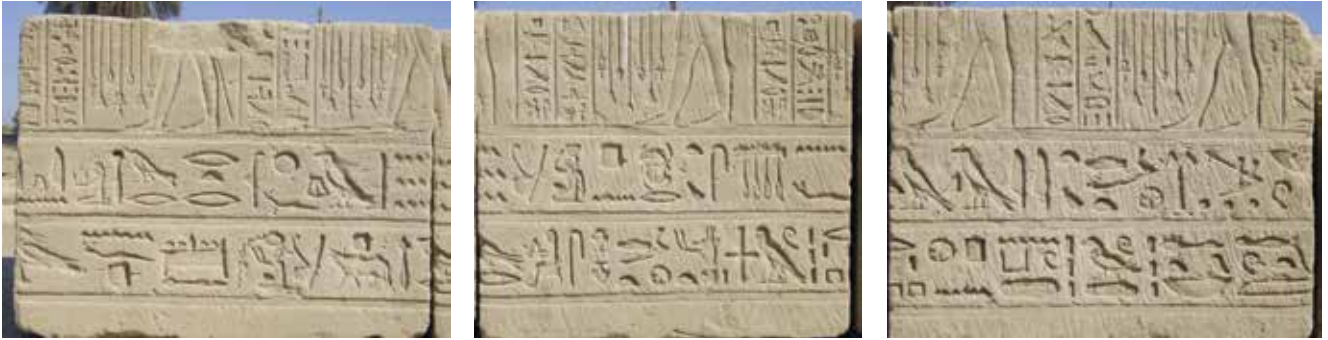
A. Salle XVI. Paroi est. Inscriptions 70-77.