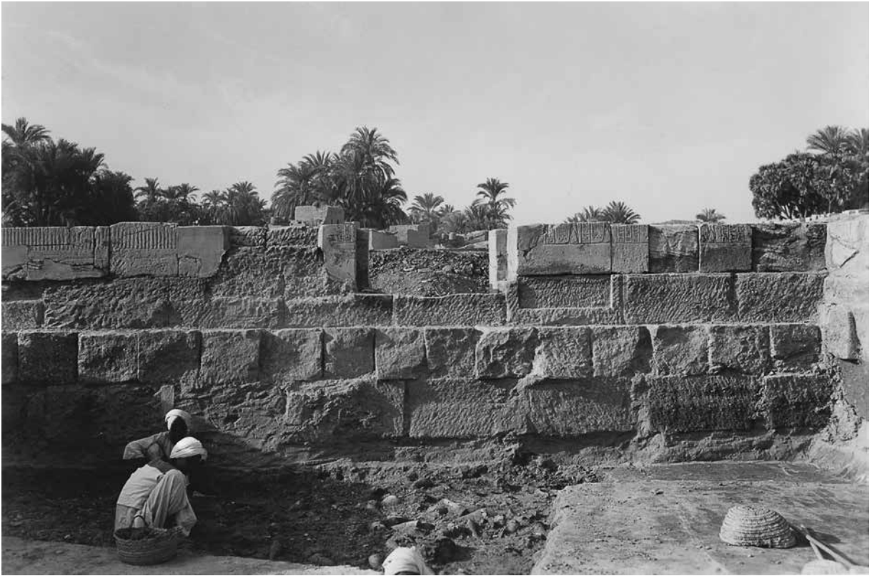
A. Salle XVII. Paroi sud. Inscriptions 81-85.