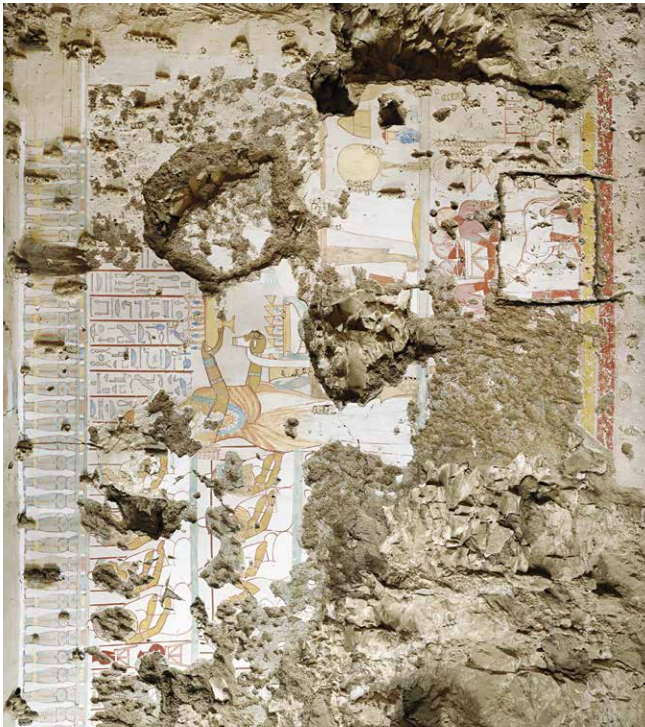
FIG. 2. La paroi sud (PM 1) : vue d'ensemble.