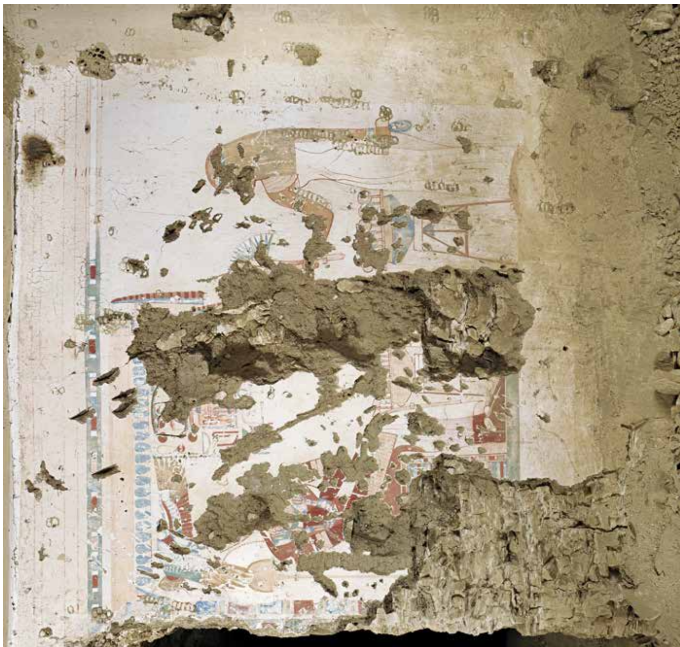
FIG. 1. La paroi nord (PM 2) : vue d'ensemble.