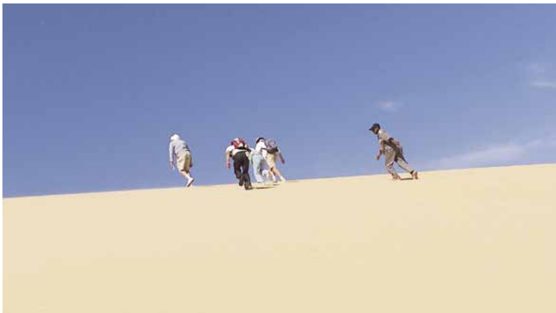
Douch, 2007, entraînant son équipe vers des sites toujours nouveaux.