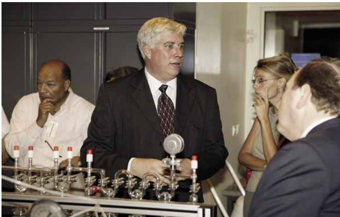
En 2006, lors de l'inauguration du laboratoire de datation ^{14}\text{C} .