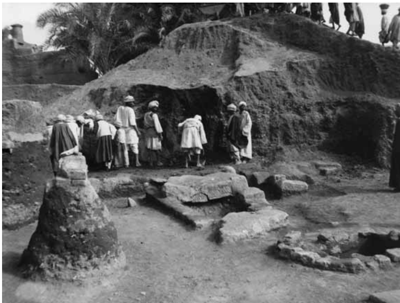
FIG. 6. Les installations du « groupe XII » dégagées en 1929.