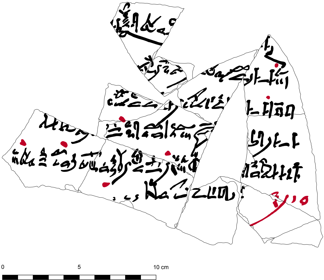
FIG. 1. Ostrakon MMA 32.I.119, fac-similé D. Lorand (redessiné d'après D. Arnold, 1992, pl. 90).