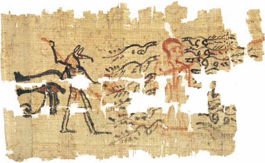
FIG. 1. P.Deir al-Medina 45.