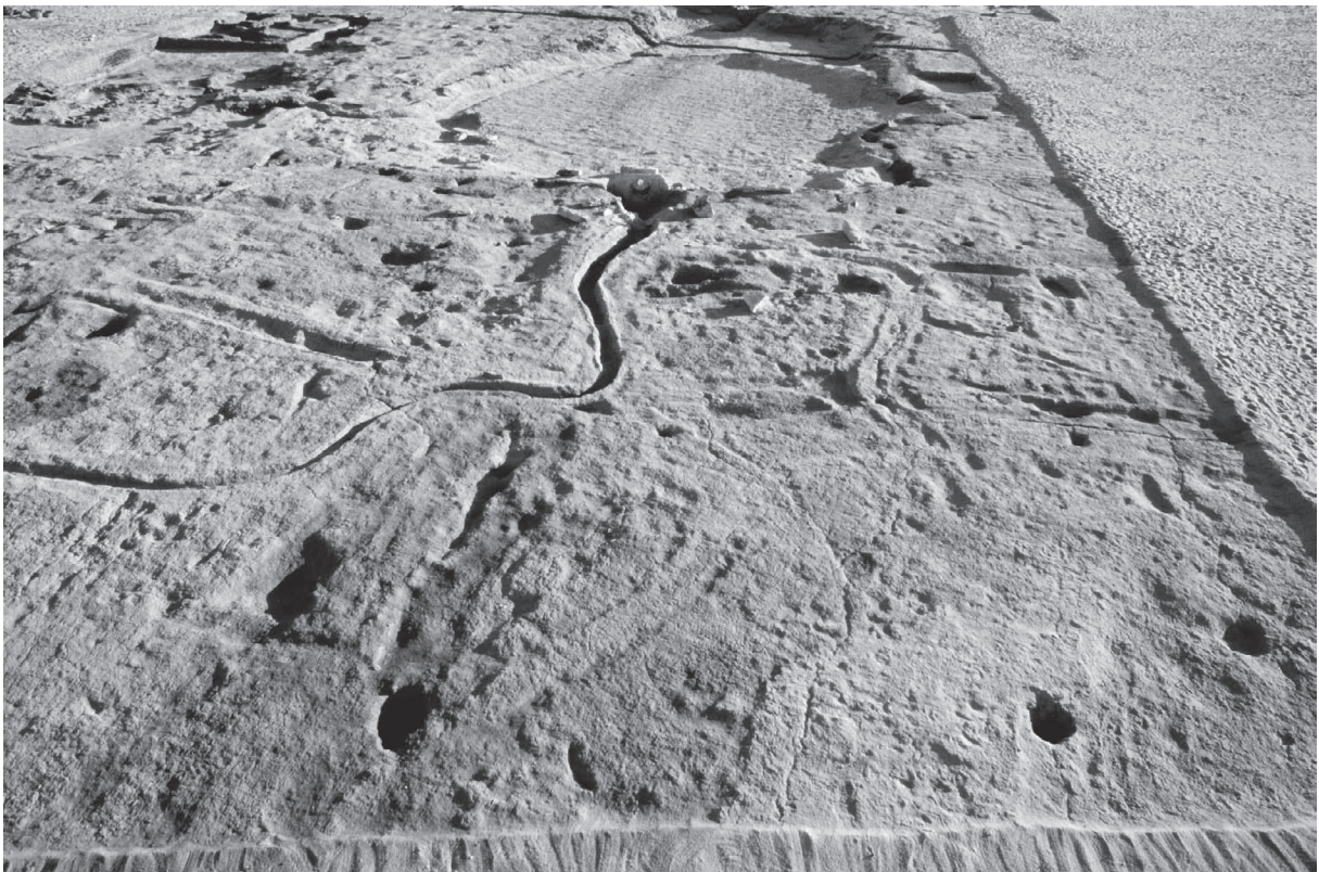
Fig. 4. Le jardin au nord du bassin MQ5d : emplacement d'arbres et rigoles d'irrigation.

Cette partie du site a fait l'objet d'une prospection visant à compléter les données sur le réseau hydraulique (qanât Q10, qanât Q11, puits MP4, tronçon de la qanât Q12). En contrebas