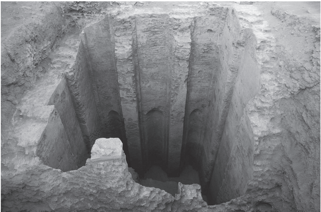
Fig. 6. Citerne.

Elle était voûtée et plusieurs possibilités s'offrent. Les faces ouest et est sont ornées d'un grand arc aveugle, dont on ne possède pas le sommet (plein cintre?), mais qu'on peut