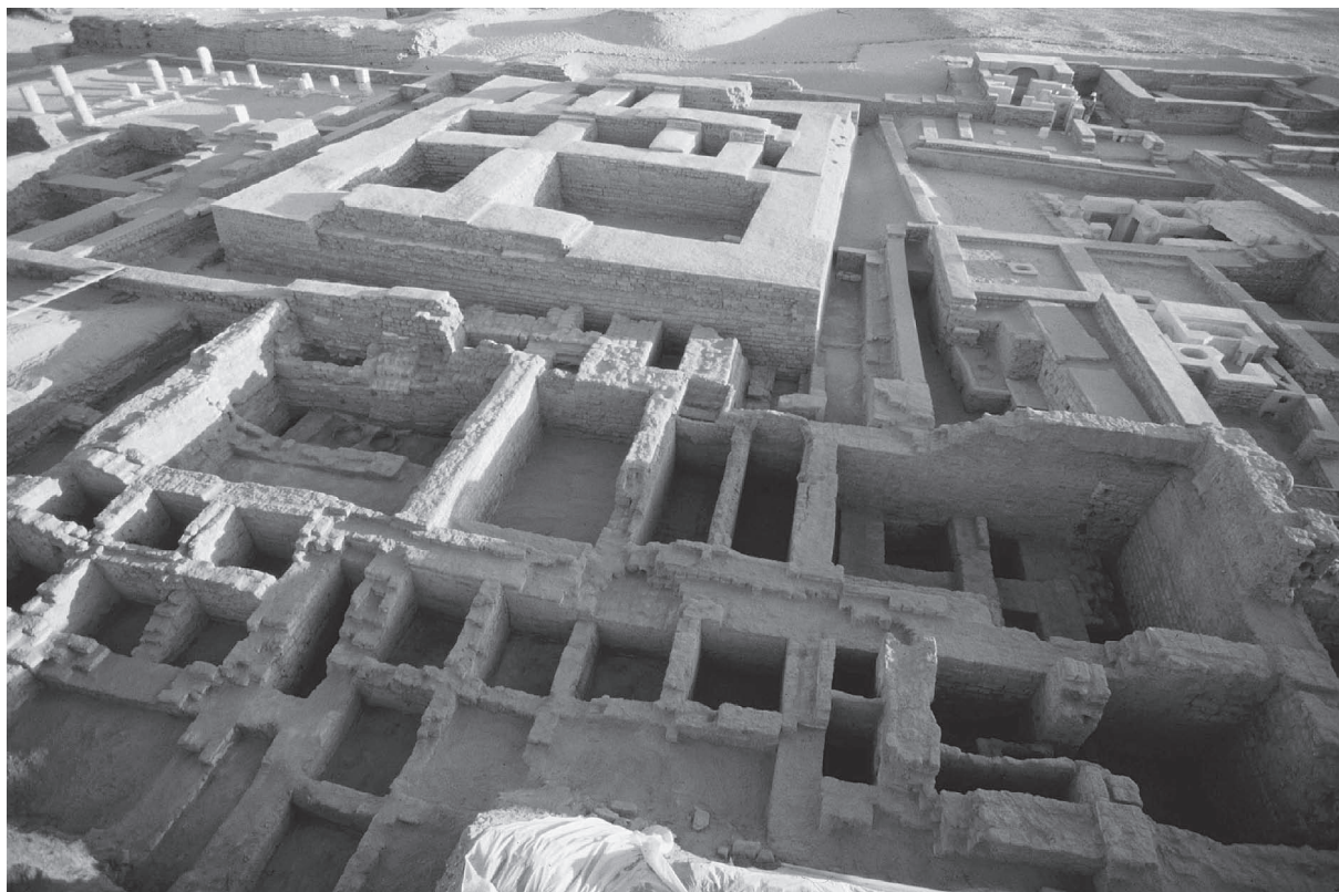
Fig. 5. Le grenier public.

Le mur sud de l'ensemble s'appuyait sur une construction antérieure. Ce bâtiment, qui a été érigé au début du II e s. av. J.-C., a été en partie conservé au niveau des caves, le mur sud ayant été détruit par la construction du pyrgos , et l'angle nord-ouest par celle du thesauros . De plan carré, tout son sous-sol était aménagé en caves, en majorité pavées de briques crues