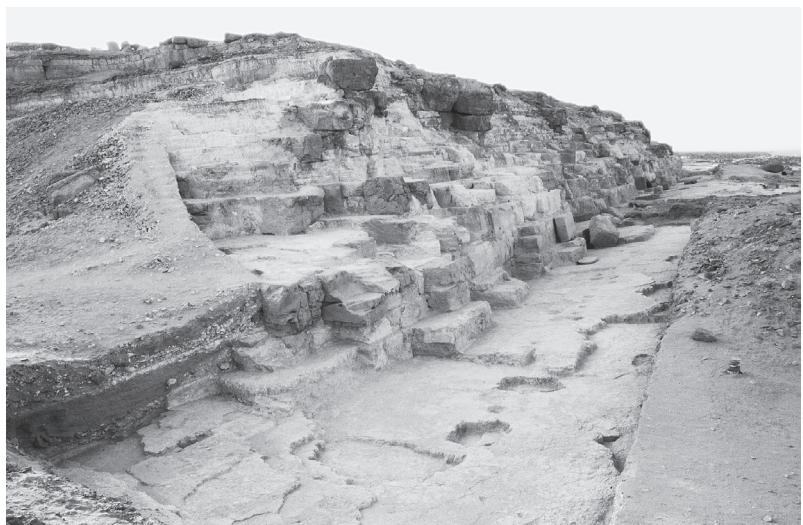
Fig. 2. Angle sud-ouest de la pyramide.

À l'instar des dégagements précédents, la fouille de la base du tétraèdre a confirmé l'aménagement d'un lit de fondation déversé, taillé dans le calcaire natif, suivant une pente moyenne de 12°. Outre des entailles rectangulaires, destinées à la mise en place des blocs de fondation, le rocher a conservé le tracé au sol de l'arête de base de la pyramide. De son côté, le décapage, en élévation, effectué sur les assises du massif de superstructure, a révélé l'image d'un profil hétérogène, dans lequel alternent une série d'assises de blocs d'appui, de hauteurs variables, avec le faciès d'un calcaire natif, conservant, pour chaque lit, l'empreinte du logement des blocs aujourd'hui disparus. Enfin, la tranchée axiale, pratiquée au sommet, entre le puits central et la face sud de