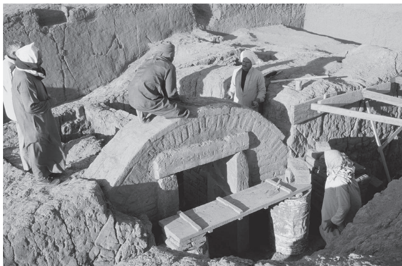
Fig. 3. Sanctuaire de Medou-nefer après dépose de la porte et remontage.

Les travaux de restauration du sanctuaire ont commencé. Les montants et le linteau de grès de la porte du naos, consolidés, ont été remis en place, et l'arc qui les surmontait reconstitué [fig. 3].