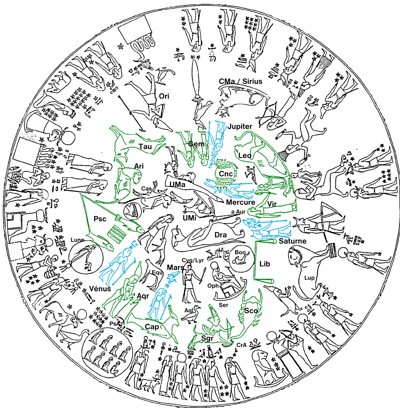
Fig. 2. La partie centrale du zodiaque. Les planètes sont représentées en bleu, et le zodiaque en vert.

D'après un dessin de B. Lenthéric, avec l'aimable autorisation du musée du Louvre. (Voir commentaire ci-contre).