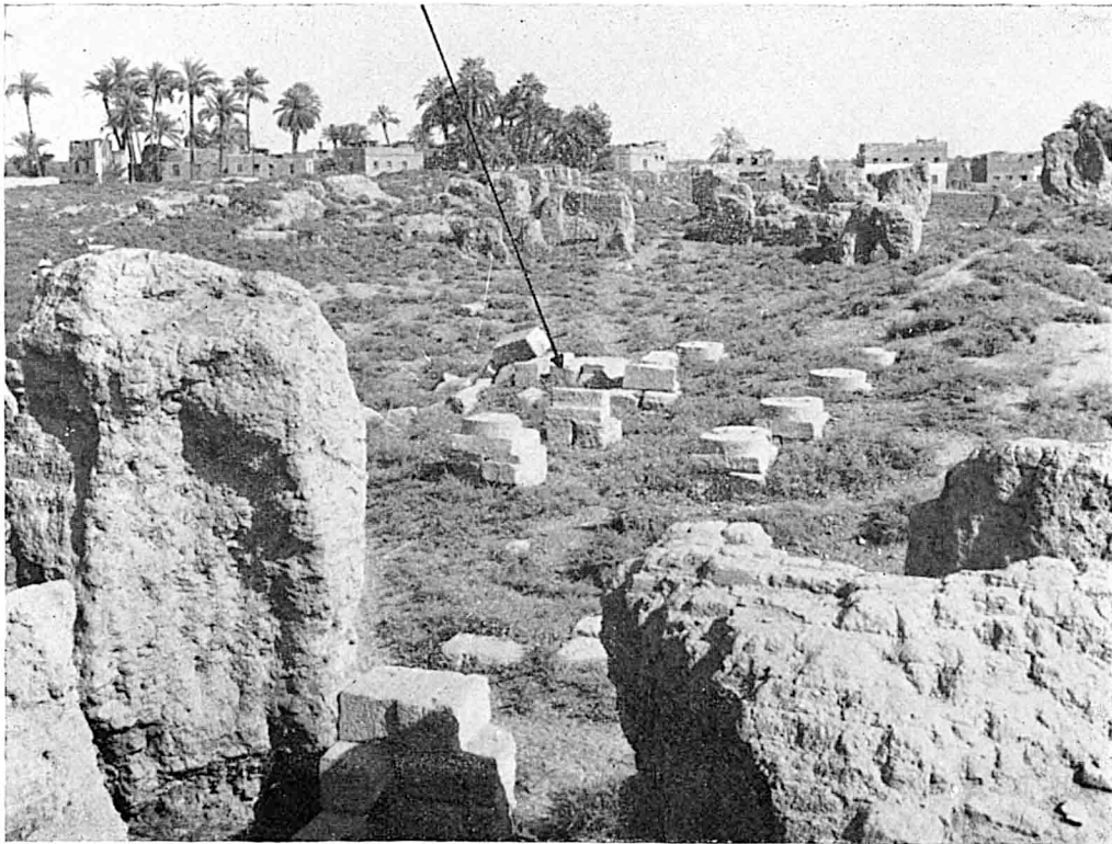
A. — L'emplacement de l'inscription in situ .