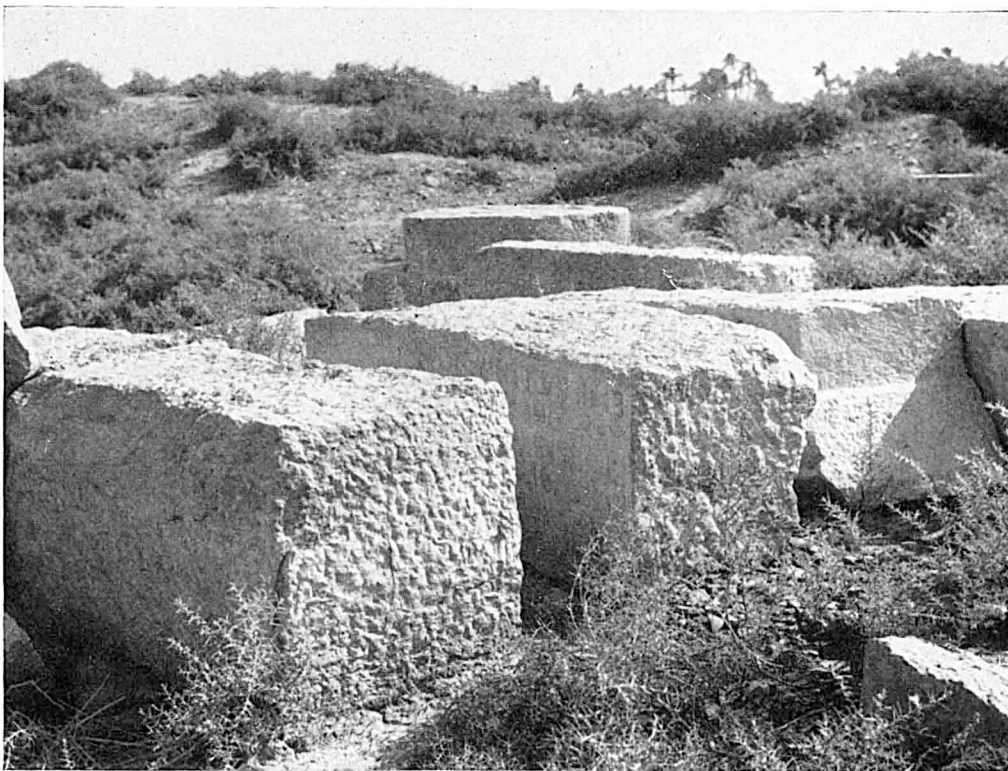
B. — Le bloc lui-même.